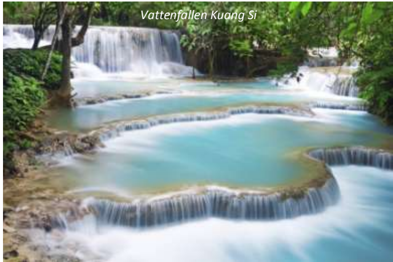
Vattenfallen Kuang Si

och Mekongfloden nedanför. Ni besöker sedan Wat Pisoun, vilket stod färdigt 1513 och med det är stadens äldsta tempel. Härifrån åker ni direkt till vattenfallen Kuang Si, där ni kan svalka er i poolen nedanför fallen, glöm inte badkläderna! Innan ni kommer åter till Luang Prabang så besöker ni den vackra fjärlsträdgården, där ni får lära er mer om Laos fjärilsarter och den lokala floran. Tillbaka i staden får ni en kort inblick i den lokala hantverkstraditionen när ni stannar vid Ock Pop Tock Living Craft Center, som framför allt är fokuserat på sidentillverkning. På eftermiddagen har ni sedan ett par timmar på egen hand, innan ni körs ut till flygplatsen för att med Lao Airlines flyga till landets huvudstad, Vientiane. Här möts ni vid ankomsten och körs till ert centralt belägna hotell.