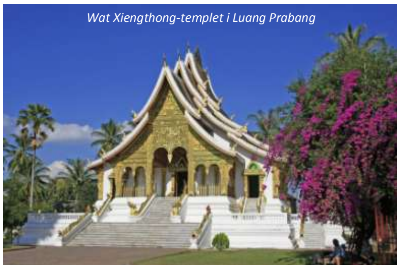
Wat Xiengthong-templet i Luang Prabang

Idag väntar en stadsrundtur som börjar med det kungliga palatsmuseet. Detta palats byggdes 1904 under den franska kolonialtiden åt Kung Sisavang Vong med familj. Platsen för palatset valdes ut så att besökare kunde gå av sina båtar precis nedanför palatset och där tas emot. När kommunisterna tog över Laos 1975 gjordes detta palats om till museum. Det har sedan dess bevarats precis om det såg ut när kungafamiljen lämnade och med tvång fördes till ett så kallat utbildningsläger. Ni