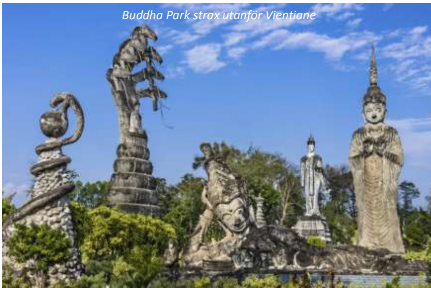
Buddha Park strax utanför Vientiane