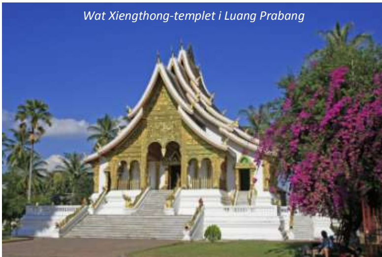
Wat Xiengthong-templet i Luang Prabang

Idag väntar en stadsrundtur som börjar med det kungliga palatsmuseet. Detta palats byggdes 1904 under den franska kolonialtiden åt Kung Sisavang Vong med familj. Platsen för palatset valdes ut så att besökare kunde gå av sina båtar precis nedanför palatset och där tas emot. När kommunisterna tog över Laos 1975 gjordes detta palats om till museum. Det har sedan dess bevarats precis om det såg ut när kungafamiljen lämnade och med tvång fördes till ett så kallat utbildningsläger. Ni