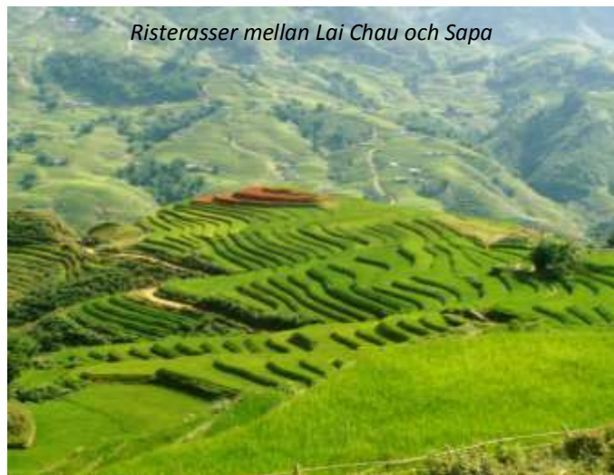
Risterasser mellan Lai Chau och Sapa