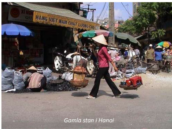
Gamla stan i Hanoi