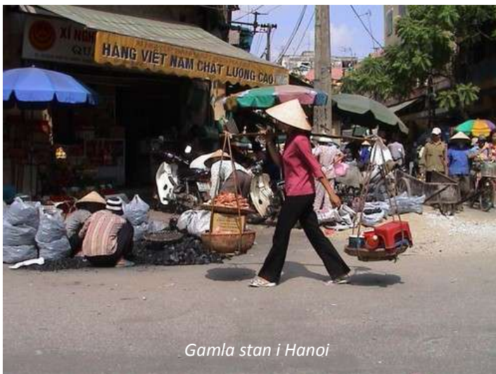
Gamla stan i Hanoi