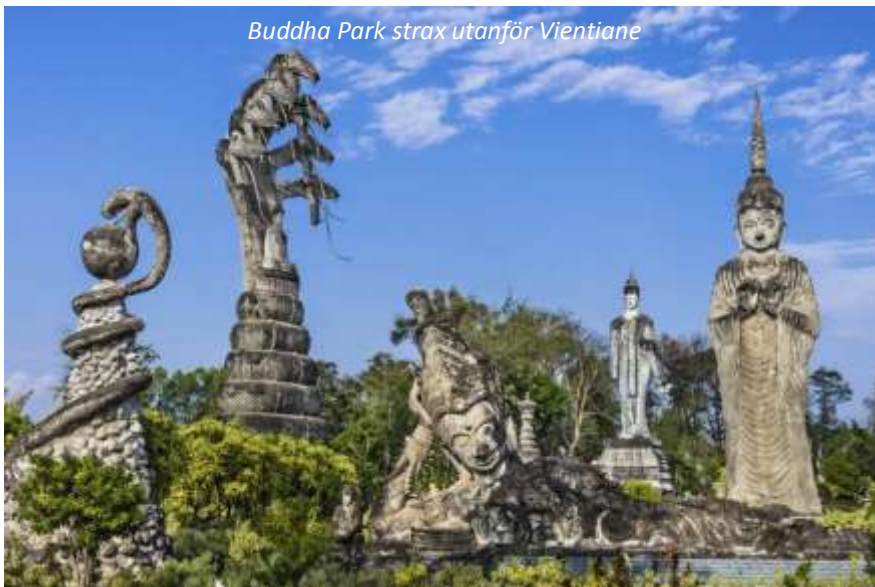
Buddha Park strax utanför Vientiane