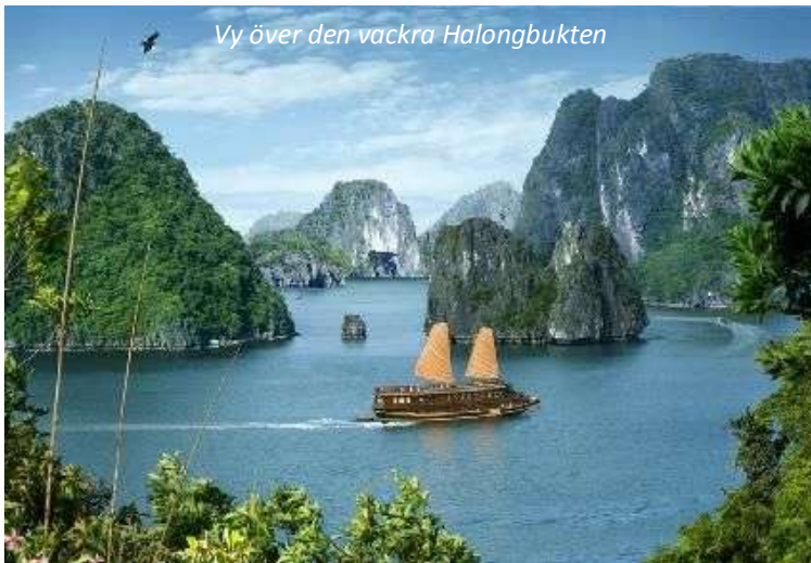
Vy över den vackra Halongbukten

Ni anländer Hanoi tidigt på morgonen, där ni möts av er guide. Härifrån körs ni först till stadens färgsprakande och folkmyllrande blomstermarknad och ser även de vackra vyerna över Hoan Kiemsjön, innan det är dags för frukost på något av huvudstadens många caféer. Ni körs sedan ner till hamnen i Halong och går där ombord på den kinesiska djonk som blir ert hem det närmaste dygnet. Efter välkomstdrink och visning av era hytter väntar en fem timmars segeltur bland de 1 969 öarna i arkipelagen. Halongbukten räknas som ett av Vietnams vackraste