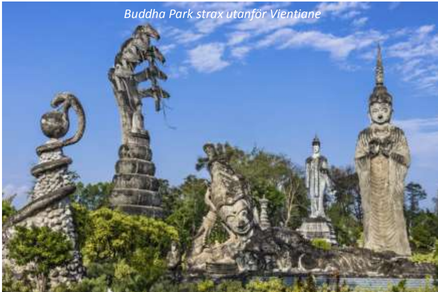
Buddha Park strax utanför Vientiane