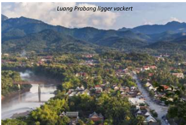
Luang Prabang ligger vackert

Ni hämtas på hotellet på förmiddagen och körs till flygplatsen. Härifrån flyger ni med Vietnam Airlines direkt till Luang Prabang i grannlandet Laos. Denna stad sattes upp på UNESCO:s världsarvslista redan 1995: "Sydostasiens bäst bevarade stad" löd motiveringen. Staden har en lång och brokig historia. Under 1300-talet var den huvudstad i det första laotiska kungariket. Från den tiden finns ett antal rikt utsmyckade tempel kvar och det är just den välbevarade och lyckade