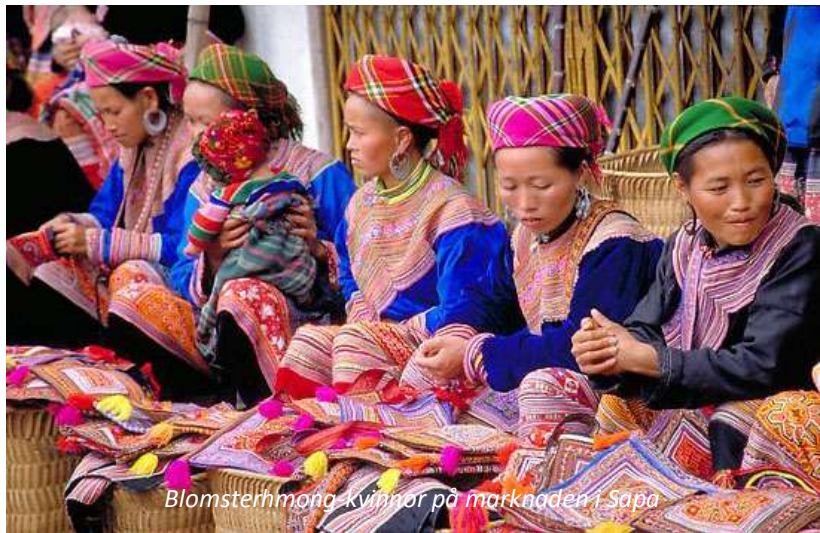
Blomsterhmong-kvinnor på marknaden i Sapa

På förmiddagen väntar Sapas berömda marknad dit folk kommer från de omkringliggande bergsbyarna för att sälja sina varor, ett härligt folkliv! Ni körs sedan längs en vacker väg till Muong Hoa-dalen, där ni kommer att ta en promenad under vilken ni besöker Y Linh Ho, en hmongby. Hmongstammen sägs vara den första som bosatte sig i detta område och de är kända för sina utsökta väverier och vackra risterrasser. Promenaden fortsätter sedan till