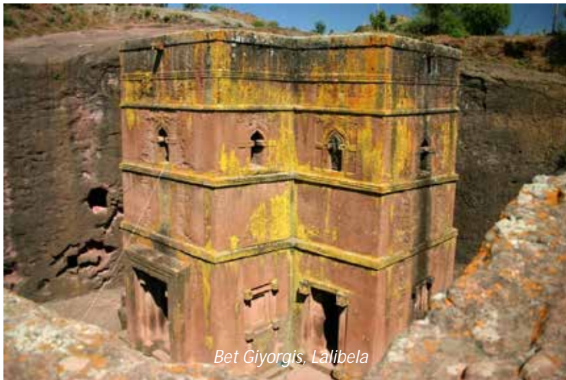
Bet Giyorgis, Lalibela

En kort flygresor tar oss till Etiopiens största sevärdhet; klippkyrkorna i Lalibela. Runt det lilla samhället, med cirka 10 000 invånare, ligger elva kyrkor uthuggna direkt ur berget. Enligt experter ska det ha krävts runt 40 000 arbetare för att hugga ut dessa, men enligt lokal tradition så avlöstes arbetarna på kvällen av änglar från himlen, som fortsatte jobbet hela natten tills arbetarna kom igen på morgonen. På detta sätt ska