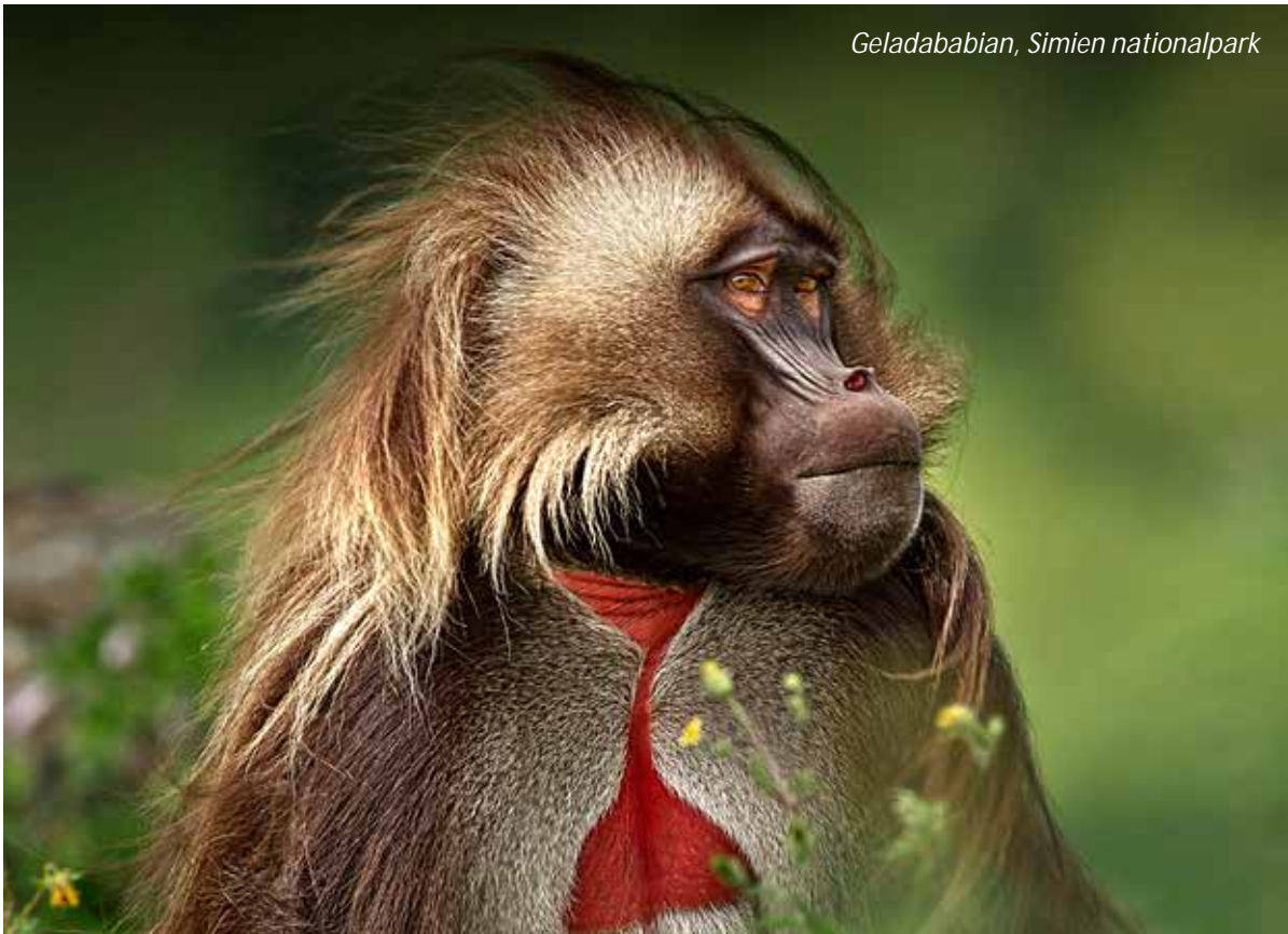
Geladababian, Simien nationalpark