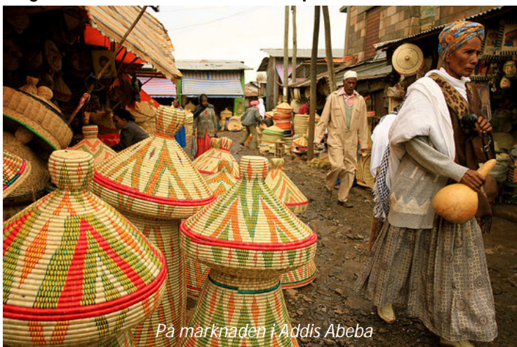
På marknaden i Addis Abeba

Vi landar i Addis Abeba, Etiopiens huvudstad, tidigt på morgonen, möts vid ankomsten och körs till hotellet. Vi har tillgång till rummen direkt vid ankomsten. Efter några timmars vila så ger vi oss ut på en stadsrundtur. På amharinja, Etiopiens största språk, betyder Addis Abeba "den nya blomman" och gör faktiskt skäl för namnet; staden är väldigt grön och lummig, med många jakarandaträd. Addis ligger på 2 350 meters höjd, vilket också gör klimatet väldigt behagligt. Staden grundades 1887 av