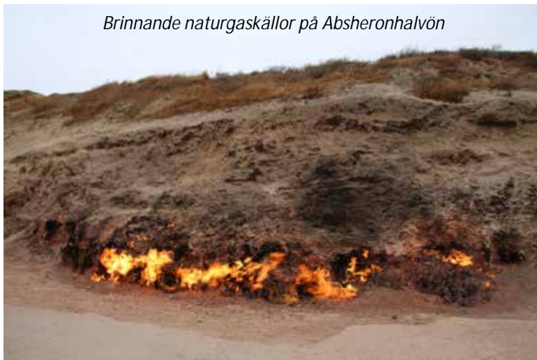
Brinnande naturgaskällor på Absheronhalvön

på 1100-talet och vars syfte fortfarande är oklart. Efter lunch på en trevlig lokal restaurang reser vi på eftermiddagen ut på Absheronhalvön. När Marco Polo besökte området på 1200-talet beskrev han hur halvön var så rik på naturgas att det överallt brann naturliga eldar. Idag har de många oljepumparna reducerat gastrycket så de flesta har slocknat, men faktiskt finns några kvar. Vi besöker en och häpnar över naturens underverk! Under eftermiddagen besöker vi också