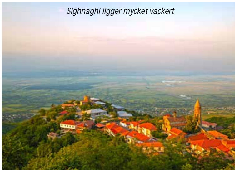
Signaghi ligger mycket vackert

Efter frukost besöker vi marknaden innan vi fortsätter till Tsinandali. Den stora sevärdheten här är det palats som poeten Alexander Chavchavadze lät bygga i början av 1800-talet och den vackra trädgården runt detta. I anslutning till palatset byggdes Georgiens äldsta vingård och fortfarande tillverkas det utmärkta vita vinet Tsinandali här. I Kondoli besöker vi en familj som har en fantastisk vinkällare med lokala viner, vi får naturligtvis möjlighet att prova några av dessa! På eftermiddagen kommer vi fram till Signaghi, som