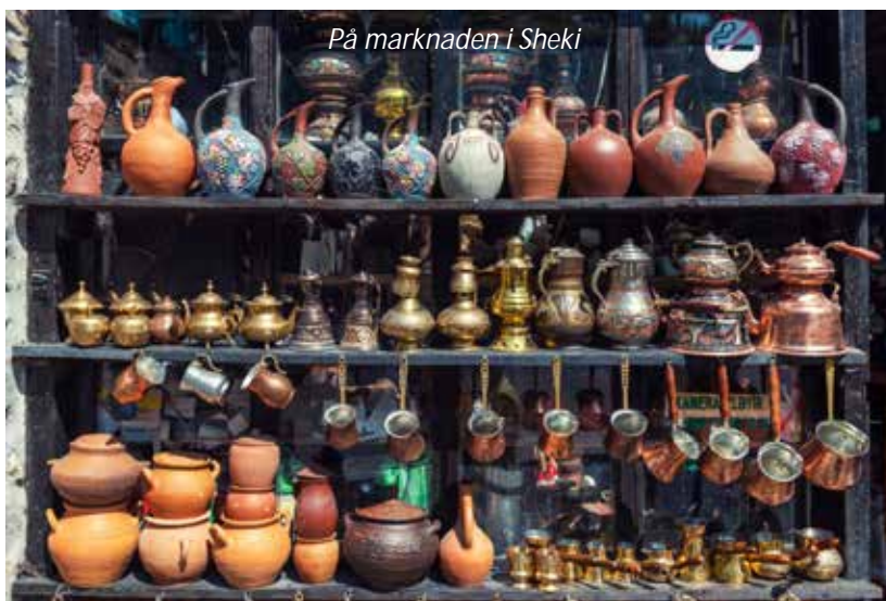
På marknaden i Sheki

Vi börjar dagen med marknaden i Sheki, som är en verklig upplevelse. Här handlas med allt från tomater och gurkor till husgeråd och kött. Även här tas vi emot med vänlig nyfikenhet och vi känner oss verkligen välkomna då turismen är något nytt och positivt för Azerbajdzjan i allmänhet och denna region i synnerhet. Sedan fortsätter resan den korta sträckan till gränsen mot grannlandet Georgien. Här får vi stämpel i passet och byter buss och