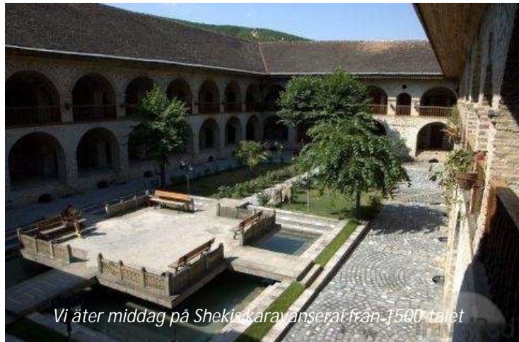
Vi äter middag på Shekis karavanserai från 1500-talet

ser det mest intressanta av det som finns kvar, som Jumamoskén, ursprungligen från 900-talet, samt Yeddi Gumbezmausoleet utanför staden. Vi äter lunch här innan vi fortsätter västerut. Vägen klättrar långsamt uppåt mot Muganlypasset, varifrån vi har en fantastisk utsikt över de mäktiga bergen i Kaukasuskedjan med Azerbajdzjans böljande, vid den här tiden på året skimrande gröna, slätter i förgrunden – vackert! När vi kommer fram till Sheki, som är en av Azerbajdzjans absolut charmigaste städer, så ger vi oss direkt ut på en stadsrundtur. Vi njuter av utsikten över staden från ett närbeläget berg, ser lämningar av de gamla befästningarna från 1600- och 1700-tal och besöker naturligtvis stadens främsta sevärdhet, Sheki Khans palats från 1700-talet. Ett besök på konstmuseet hinner vi också med, där vi ser hur hantverkare gör en specialitet för Sheki – fantastiska fönster av färgat glas. På kvällen äter vi middag på en restaurerad karavanserai från 1500-talet. Denna historiska miljö blir säkert ännu mer minnesvärd än den traditionella azeriska maten, här bodde en gång de karavaner som gick längs Sidenvägen.