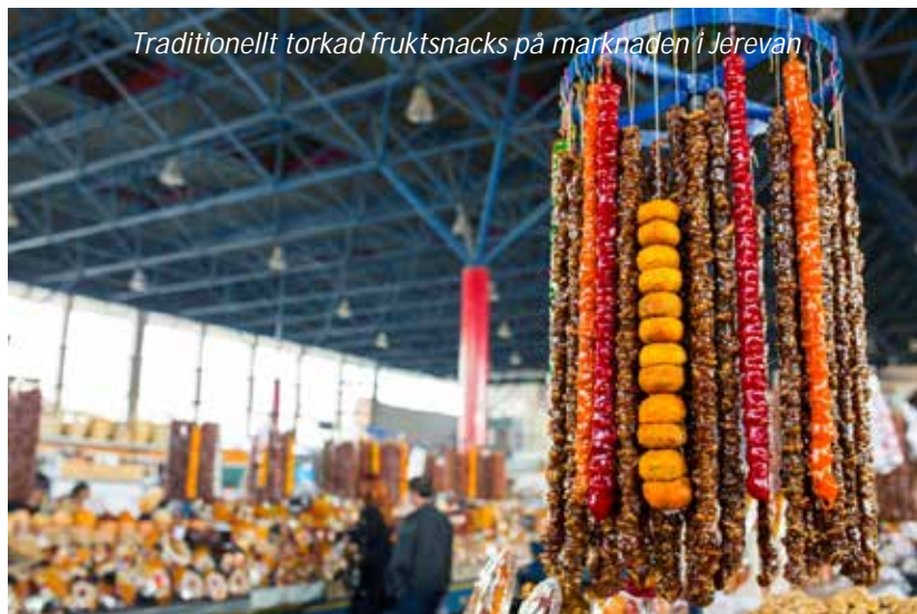
Traditionellt torkad fruktsnacks på marknaden i Jerevan

Vi börjar utforska charmiga Jerevan på förmiddagen med ett besök på frukt- och grönsaksmarknaden. Här är ett härligt folkvimmel, då bönder kommer in från den omgivande landsbygden för att sälja sina varor. Vi fortsätter sedan till det intressanta museet Matenadaran. Namnet på museet betyder bibliotek på gammal armeniska och här förvaras tiotusentals gamla och mycket vackra skrifter. Efter lunch lämnar vi staden