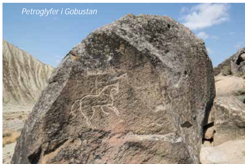
Petroglyfer i Gobustan

Förmiddagen är vikt åt Azerbajdzjans andra världsarv, de fantastiska petroglyferna i Gobustan som sattes upp på Unescos världsarvslista 2007. Idag omges klipporna här av en torr halvöken, men det har inte alltid varit så. För 12 000 år sedan så var Kaspiska havets vattennivå 80 meter högre än den är idag och detta område var täckt av riklig vegetation. Grottona här låg bara meter från vattnet och var därför en perfekt plats för att slå sig ner