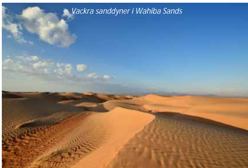
Vackra sanddyner i Wahiba Sands

Efter frukost fortsätter vi resan mot Wahiba Sands, ett ökenområde i östra Oman som mäter 180 gånger 80 kilometer. På vägen stannar vi vid den populära och lättillgängliga oasen Wadi Bani Khalid. Wadin består av ett antal större pooler och mindre klippbad kantade av berg och palmer. Vattnet är svalkande med en härlig turkos färg. Omklädningsrum och café finns. Här har vi möjlighet att ta oss ett uppfriskande dopp, men vi ber er observera att här, liksom på de flesta andra platser, råder klädkod. Män måste ha längre badshorts och t-shirt och kvinnor måste ha långbyxor (till exempel längre cykelbyxor) och t-shirt eller liknande. Vi kör vidare till Wahiba Sands där vi äter lunch hos en lokal beduinfamilj. Det bjuds även på dadlar och omanskt kaffe med kardemumma. Vi sitter på golvet och äter och familjen visar hur en traditionell måltid och samkväm kan se ut. Det finns endast ett fåtal uppkörda spår i öknen att följa och här krävs fyrhjulsdrivna fordon. På vägen till vårt lyxiga ökencamp Desert Nights kör vi "dunebashing", berg och dalbana upp och ner längs de mäktiga sanddynerna. Väl framme checkar vi in i våra smakfulla och traditionellt inredda bungalows med egen uteplats. Inför solnedgången åker vi upp till sanddynerna och får springa upp och ner, klättra och känna på den härliga kopparfärgade sanden. Vi njuter av utsikten över dynerna, dryck och snacks ingår. På kvällen får vi avnjuta en stor vällagad buffé.