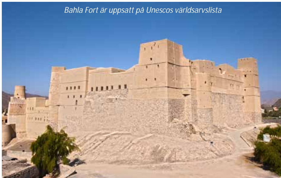
Bahla Fort är uppsatt på Unescos världsarvslista

även Bahla fort som är uppsatt på Unescos världsarvslista. Vi vandrar runt i fortet som började byggas på 1200-talet i adobe (lera uppblandat med halm). Fortet restaurerades på 1990-talet. Från fortets torn, murar och borggårdar har du fin utsikt över bergen och staden. I närheten ligger palatset Jabreen från 1600-talet. Inuti får du en bättre bild över hur Omans äldre byggnader var konstruerade och inredda. Här finns en labyrint av rum, rikt målade/dekorerade trätak, vackra glasfönster och innergårdar. På eftermiddagen anländer vi till Nizwa där vi besöker souqen som är en av Omans äldsta. Marknaden är uppdelat i olika områden som täcker in kryddor, silver, kött och fisk, frukt och grönt och keramik med mera. Nizwa är centrum för Omans dadelodling och här finns en stor avdelning där du kan prova och köpa olika dadel sorter. Utanför souqen finns en affär där du kan prova och köpa Omans speciella efterrätt halwa , smaksatt av olika kryddor såsom saffran och kardemumma och små stånd där du kan prova teer från bergen och lokal gatumat. Vi ser också naturligtvis det magnifika fortet som byggdes på 1600-talet. Denna natt bor vi på Antique Inn vilket är en renoverad historisk byggnad med traditionell inredning som ligger centralt i den gamla stadsdelen.