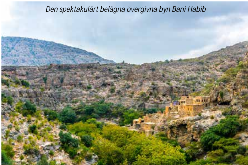
Den spektakulärt belägna övergivna byn Bani Habib

gröna dadelpalmslundar. Vi tar en kort promenad i denna gröna oas innan vi fortsätter till en övergiven del av staden. I Oman lämnas ofta äldre byar att förfalla medan nya byggs. Väl uppe i bergen så går vi en trevlig och vacker promenad mellan bergsbyarna Alagar, Alain och Alshir. Härifrån har du vackra bergsvyer, klar luft och får se rosplanteringar, granatäpple- och valnötsträd. I mars och april blommar rosorna och rosvatten och parfym tillverkas i området. Stigen går längs en bergsplatå genom gamla traditionella byar. Vi avslutar denna innehållsrika dag