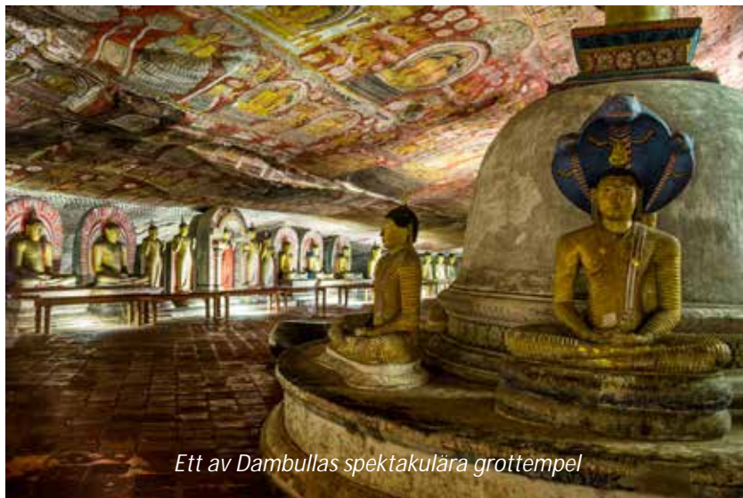
Ett av Dambullas spektakulära grottempel

Efter frukost lämnar vi Negombo och reser åt nordost mot Dambulla och resans första världsarv, de berömda grottemplen. Klippan som templen ligger i sträcker sig 160 meter över den omgivande slätten och i området finns mer än 80 grottor. Av dessa är det dock bara i fem som det finns heliga buddhistiska föremål och det är tre som utmärker sig lite extra, främst Den gudomlige kungens grotta. Denna grotta domineras av den drygt 14 meter långa liggande statyn av Buddha, en av de figurer som skulpterats fram direkt ur