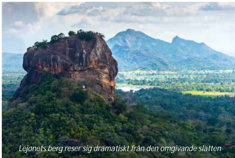
Lejonets berg reser sig dramatiskt från den omgivande slätten

På förmiddagen besöker vi det så kallade Lejonets berg som reser sig brant från det flacka landskapet. Berget är känt för ruinkomplexet på toppen, byggt av Kung Kashyapa på 400-talet. Kung Kashyapa flyttade år 477 från Anuradhapura till Sigiriya och gjorde platsen till huvudstad på grund av dess strategiska läge. Staden är ett fantastiskt exempel på tidig stadsplanering; kungen byggde ett enormt palats med omkringliggande trädgårdar, badbassänger och skulpturer på toppen av den ca 200 meter höga klippan, alltsamman utifrån geometriska system. Efter bara 20 år som kungasäte och huvudstad omvandlades Sigiriya till ett buddhistiskt kloster. På vägen upp till komplexet kan man se fantastiskt vackra, 1 500 år gamla, välbevarade