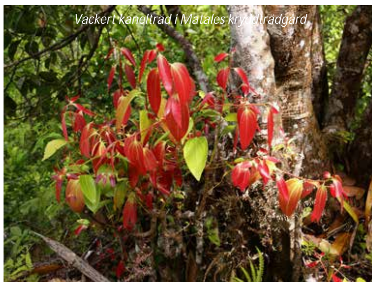
Vackert kanelträd i Matales kryddträdgård

Idag reser vi vidare söderut mot en av resans höjdpunkter, staden Kandy. På vägen stannar vi i Matale, där vi besöker en kryddträdgård. Här får vi en guidad rundvisning och ser de många olika kryddor som Sri Lanka är känt för, som till exempel kanel, muskotnöt, kardemumma, kryddnejlika med flera. Här får ni se hur de växer, odlas och skördas och naturligtvis ha möjlighet att köpa med er en påse eller två.