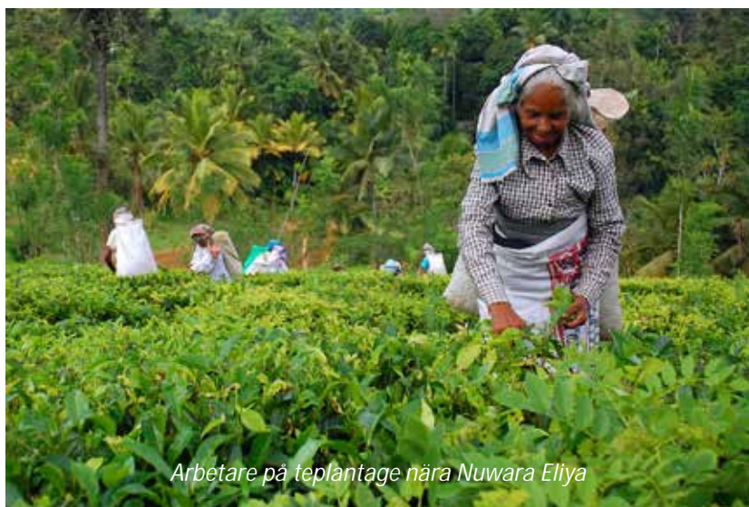
Arbetare på teplantage nära Nuwara Eliya

På förmiddagen gör vi en utflykt till nationalparken Horton Plains, som tillsammans med Peak Wilderness Protected Area och Knuckles Conservation Forest utgör världsarvet The Central Highlands of Sri Lanka. De montana regnskogarna här anses som en så kallad superhotspot för biologisk mångfald - mer än hälften av Sri Lankas endemiska (det vill säga att de endast finns här) ryggradsdjur, hälften av landets endemiska blommande växter och mer än en tredjedel av dess endemiska träd, buskar och örter är begränsade till