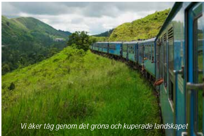
Vi åker tåg genom det gröna och kuperade landskapet

Araliya Green Hills Hotel (4*). Frukost.