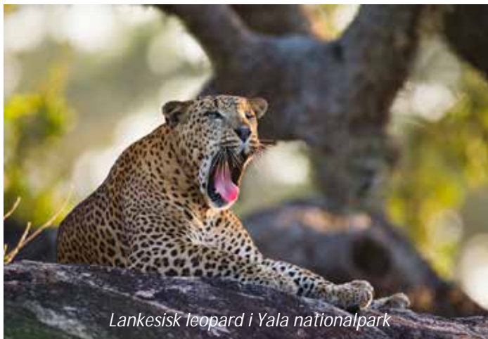
Lankesisk leopard i Yala nationalpark

Mest känd är Yala dock för att vara en av de bästa platserna i världen för att se leoparder. Vissa hävdar att Yala har den största leopardtätheten av alla nationalparker i världen, men detta är föremål för diskussion. Vad som dock gör Yala ovanligt är att här är leoparderna relativt lätta att se, även om det förstås aldrig finns några garantier. Förutom leoparder, den lankesiska leoparden är en egen underart ( Panthera pardus kotiya ), så finns här hela 44 däggdjursarter som till exempel läppbjörn, vattenbuffel, vildsvin, axishjort, sambarhjort och guldschakal. Yala har även ett mycket rikt fågelliv med 215 konstaterade arter av vilka kan nämnas indisk tofsörn, vitbukad havsörn, mindre flamingo, skedstorkar, svarthalsad stork och ormhalsfåglar. Sex fågelarter endemiska för Sri Lanka kan ses i nationalparken: Ceylontoko, Singalesisk bankivahöna, Ceylunduva, karmosinstrupig barbett (finns dock även i sydvästra Indien) och Sri Lankatrasttimalia. I parken finns också sumpkrokodil och saltvattenkrokodil. En spännande eftermiddag!