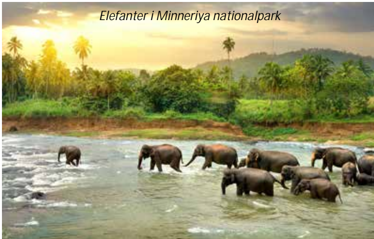
Elefanter i Minneriya nationalpark

väggmålningar som gestaltar kvinnor och på toppen av klippan har ni en imponerande utsikt över det vackra landskapet med djungel och berg. Även Sigiriya är naturligtvis uppsatt på Unescos världsarvslista. På eftermiddagen kommer vi att göra en game drive i nationalparken Minneriya, som framför allt är känt för sin stora population av lankesisk elefant. Denna är en underart till den asiatiska elefanten och är den största av de asiatiska elefanterna. Speciellt är även att mindre än var tionde hanne har betar. Faktiskt