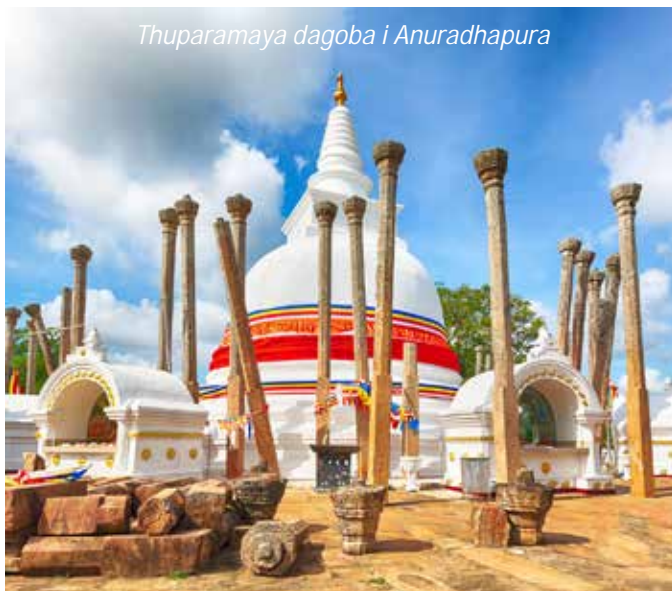
Thuparamaya dagoba i Anuradhapura

Vi börjar dagen med att besöka Anuradhapura. Denna gamla kungastad var Sri Lankas första huvudstad. Staden grundades på 400-talet f Kr men de första arkeologiska fynden kan dateras så långt bak som till 1000 år f Kr. Anuradhapura var en av de viktigaste platserna i den buddhistiska världen, ända tills staden i början av 1000-talet erövrades av den sydindiska Chola-dynastin och sedan började förfalla. Från 1200-talet låg staden dold under den täta skogen. Anuradhapurans många palats, kloster, stupor och stensulpturer återupptäcktes först i början av 1800-talet av engelsmän. Efter utgrävningar och restaureringar blev staden igen en vallfärdsort för buddhister som ville besöka de många stuporna, som enligt sägnen skulle innehålla relikier av Buddha själv. Staden är i dag