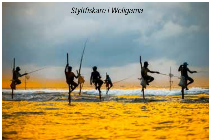
Styltfiskare i Weligama

Efter frukost reser vi västerut mot ännu ett av Sri Lankas världsarv, staden Galle. På vägen ser vi de berömda styltfiskarna i Weligama. Denna fiskemetod, där de för ner en smal påle i botten några meter ut från stranden och därifrån kastar ut sitt bete, har mycket gamla anor. Vi fortsätter sedan till Galle, som ligger vackert på en halvö. Holländarna gjorde staden till sin administrativa huvudstad på mitten av 1600-talet och anses idag vara en av de finast bevarade städer som byggts av européer i Syd- och Sydostasien. Särskilt fortet är mycket imponerande, det började byggas av