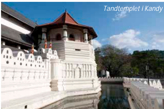
Tandtemplet i Kandy

Kandy grundades redan på 1300-talet och blev huvudstaden för ett rike med samma namn 1592. Denna tid präglades av oroligheter på ön och många flydde till de inre bergsområdena bort från kustområdena som de europeiska stormakterna koloniserade. Trots att staden intogs flera gånger under de följande seklen så lyckades Kandy vidmakthålla sin självständighet fram till dess att den slutligen intogs av britterna 1815. Kandy förblev dock ett viktigt religiöst centrum och ses idag som en helig stad för buddhister. Staden är också känd för att ha bevarat många gamla seder och bruk och är verkligen