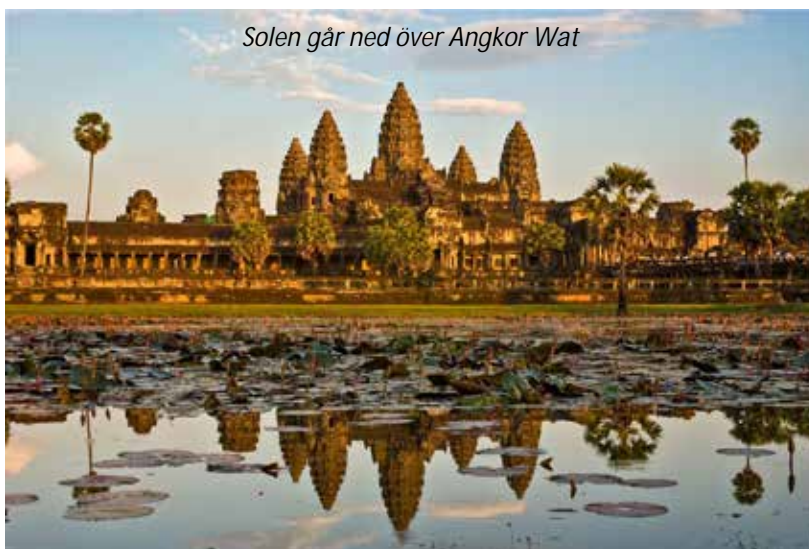
Solen går ned över Angkor Wat

Ett par dagar väntar med utflykter till det fantastiska tempelkomplexet i Angkor, huvudstad för Khmerriket från 802 e Kr fram till mitten av 1300-talet. Vi börjar i söder vid Angkor Thom, en tio km 2 stor befäst stad byggd av Angkors största kung, Jayavarman VII (1181-1201). Angkor Thom omges av en 12 kilometer lång mur, som är cirka åtta meter hög, och en 100 meter bred vallgrav, där det sägs att det fanns krokodiler för att ytterligare avskräcka fiender. I centrum av området står Bayon, som är unikt för Angkor och den näst största byggnaden efter Angkor Wat.