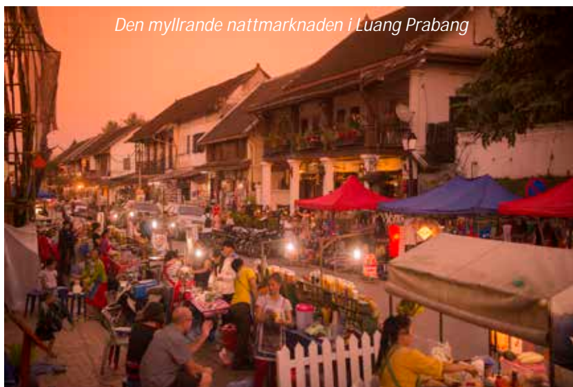
Den myllrande nattmarknaden i Luang Prabang

Idag väntar en stadsrundtur som börjar med det kungliga palatsmuseet. Detta palats byggdes 1904 under den franska kolonialtiden åt Kung Sisavang Vong med familj. Platsen för palatset valdes ut så att besökare kunde gå av sina båtar precis nedanför palatset och där tas emot. När kommunisterna tog över Laos 1975 gjordes detta palats om till museum. Det har sedan dess bevarats precis om det såg ut när kungafamiljen lämnade och med tvång fördes till ett så kallat utbildningsläger. Vi kommer sedan