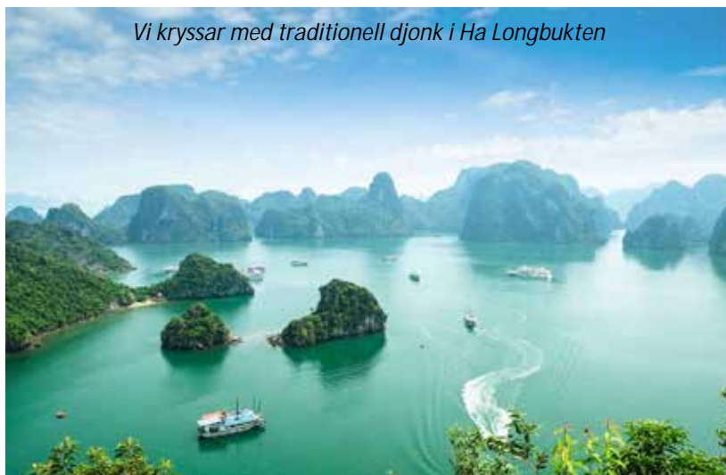
Vi kryssar med traditionell djonk i Ha Longbukten

Efter en tidig frukost så besöker vi något som är ett måste vid ett besök i Vietnam: Ho Chi Minhs mausoleum. Här ligger Ho Chi Minh på lit de parade i en glassarkofag, han dog 1969 och fick aldrig uppleva det enade Vietnam han kämpat för. Vi åker sedan österut till en av Vietnams, och hela Sydostasiens, främsta sevärdheter; Ha Longbukten med sin underbart vackra arkipelag. Här finns 1 969 öar vilka består av kalksten som är mycket porös. Vind och vatten har under århundraden format dessa fantastiskt formade öar