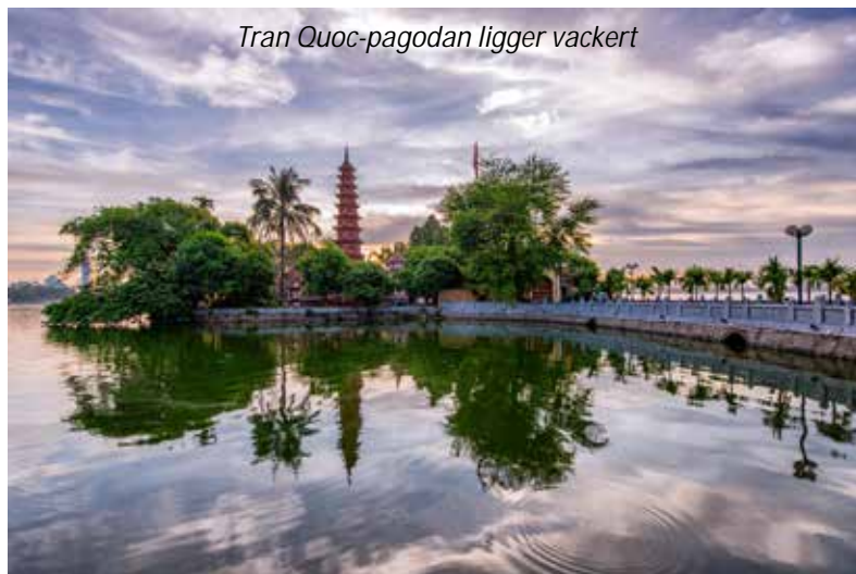
Tran Quoc-pagodan ligger vackert

Vi börjar dagens stadsrundtur med att åka cykeltaxi, så kallad cyclo, från vårt hotell till den gamla stadsdelen. Gatorna sjuder av liv och varje kvarter har sin specialitet, en kvarleva från det gamla skräsystemet. Vi fortsätter sedan med buss genom det så kallade French Quarter, där vi kommer att se många hus och palats från den franska kolonialtiden. Härifrån tar vi sedan en promenad till Ngoc Ha, som är som en by mitt i denna miljonstad. Här lever människorna som på landsbygden fast de är omgivna av höghus. Vi fortsätter sedan till Tran Quoc-pagodan som är