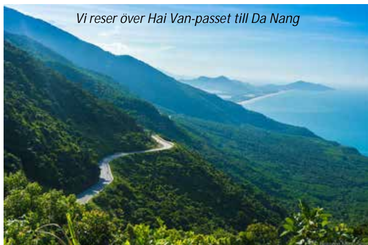
Vi reser över Hai Van-passet till Da Nang

Vår resa går idag söderut mot staden Da Nang. Vägen dit går över Hai Van-passet som är en av Vietnams absolut vackraste vägar. Utsikten från toppen av passet är fantastisk! I Da Nang besöker vi det berömda museet Cham, känt för sin samling av sandstensskulpturer. De äldsta av dessa är från 300-talet e Kr. Vi fortsätter sedan till tempelkomplexet My Son, 69 km sydväst om Da Nang. Detta komplex, som sattes upp på Unescos världsarvslista 1999, var en kejsarlig stad under Champariket och uppfördes från 300-talet fram till 1100-talet. Helgedomen är ett stort komplex av religiösa byggnader med