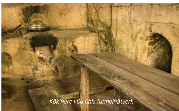
Kök nere i Cu Chis tunnelnätverk

Vi börjar dagen med en stadsrundtur i denna enorma stad, Ho Chi Minh-staden har cirka 7,2 miljoner invånare inräknat förorterna. Khmererna kallade staden för Prey Nokor, men när staden kom att domineras av från norr inflyttade vietnameser på 1600-talet döptes den om till Sai Gon. Staden intogs av Frankrike 1859 och gjordes till huvudstad för Franska Indokina. Staden döptes om 1976 efter den tidigare nordvietnamesiska ledaren Ho Chi Minh. Under stadsrundturen ser vi de viktigaste sevärdheterna som det berömda stadshuset Hotel de Ville, katedralen Notre Dame som stod färdig 1880, det forna sydvietnamesiska presidentpalatset och det intressanta krigsmuseet. Efter lunch på en lokal restaurang väntar oss en av Vietnams mest berömda sevärdheter: Cu Chi-tunnlarna. Dessa utgör en del av ett fantastiskt underjordiskt nätverk av tunnlar som användes av vietnameserna under Vietnamkriget. Systemet innehåller över 200 km tunnlar! Idag är dessa utvidgade, men är ändå inget för de med cellskräck. Tunnlarna här var Viet Congs bas för den välkända Tetoffensiven 1968.