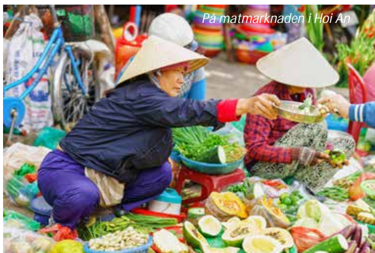
På matmarknaden i Hoi An

En av många höjdpunkter med en resa i Vietnam är maten! Denna förmiddag kommer vårt fokus att ligga på det vietnamesiska köket, då vi åker till marknaden där vi kommer att gå runt och botanisera bland exotiska frukter, torkade och färska örter, olika sorters nudlar, kryddor, mängder med olika sorters fisk med mera. Det är ett härligt folkvimmel och vår guide kommer att förklara för oss hur man ser vad man ska köpa och dess användningsområde i olika rätter. Vi kommer sedan till Vy's Market Restaurant, där vi går runt bland de olika