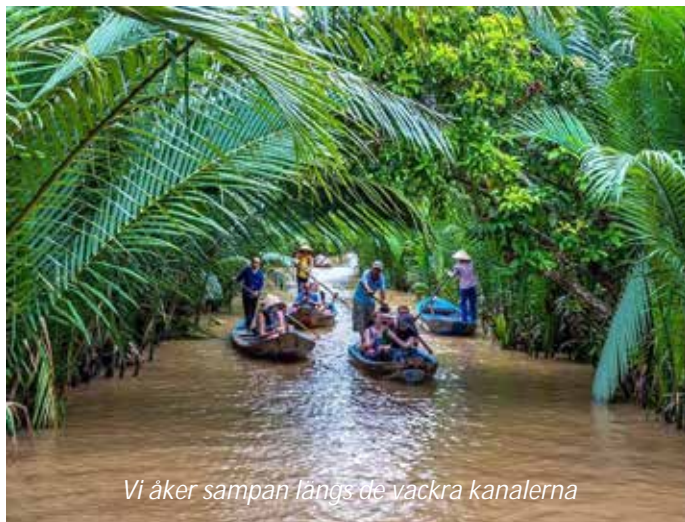
Vi åker sampan längs de vackra kanalerna

studera hur vardagslivet ser ut för de som lever i den här delen av Mekongdeltat. Vi tar sedan häst och vagn genom byn och ser biodlingar, fruktodlingar och papperstillverkning medan vi blir hälsade av de vänliga byborna! Lunch äter vi på en liten lokal restaurang, där vi även får provsmaka olika frukter varav vissa vi med säkerhet inte ens har sett förut. Vi hinner också med en rofylld båttur längsmed kanaler kantade av kokospalmer i en sampan , vilket är en regiontypisk flatbottnad träbåt. Tillbaka i My Tho igen åker vi direkt till flygplatsen utanför Ho Chi Minh-staden, varifrån vi flyger till grannlandet Kambodja. Vi landar i den charmiga staden Siem Reap, som är inkörporten till