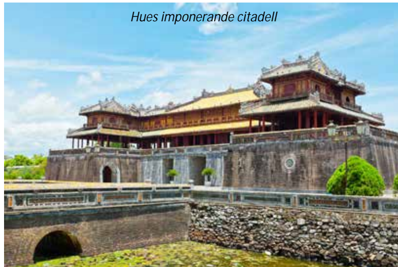
Hues imponerande citadell

Hue är kanske Vietnams mest intressanta stad. Den blev huvudstad 1802 under Nguyen-dynastin som sträckte sig fram till 1945 och den största sevärdheten är utan tvekan det enorma citadellet som byggdes på 1800-talet. Staden sattes redan 1993 upp på Unescos världsarvslista och varför kommer vi att förstå efter den stadsrundtur som väntar idag. Vi hämtas på hotellet och färdas med cykeltaxis över den berömda bron Trang Tien, som ritades av Gustave Eiffel och stod färdig 1899, till den färgsprakande marknaden Dong Ba. Vi