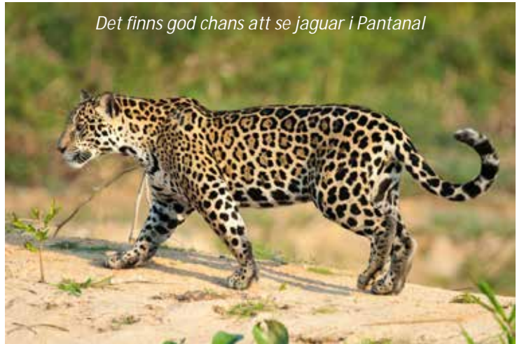
Det finns god chans att se jaguar i Pantanal

Jaguar Ecological Reserve. Frukost, lunch, middag.