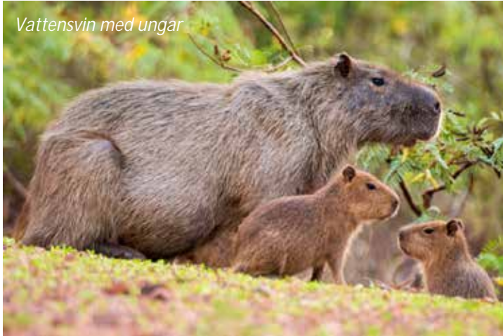
Vattensvin med ungar

Ännu en dag i fantastiska Pantanal! På morgonen går vi längs någon av lederna runt lodgen och kommer tillbaka lagom till lunch. Efter ett par lediga timmar så åker vi till det stora träskområdet vid Campo Jofre, en kort sträcka söder om vår lodge. Här har vi möjlighet att se stora grupper med vattensvin och kajmaner och här ses ofta hjortar och anakondor. Dessutom är det kanske den bästa platsen för att se ozelot. Efter vår rundtur här så besöker vi en lokal farm, stora delar av Pantanal är jordbruksmark och vi får här lära oss mer om de grödorna och hur man bedriver ett jordbruk i ett område som till stora delar av