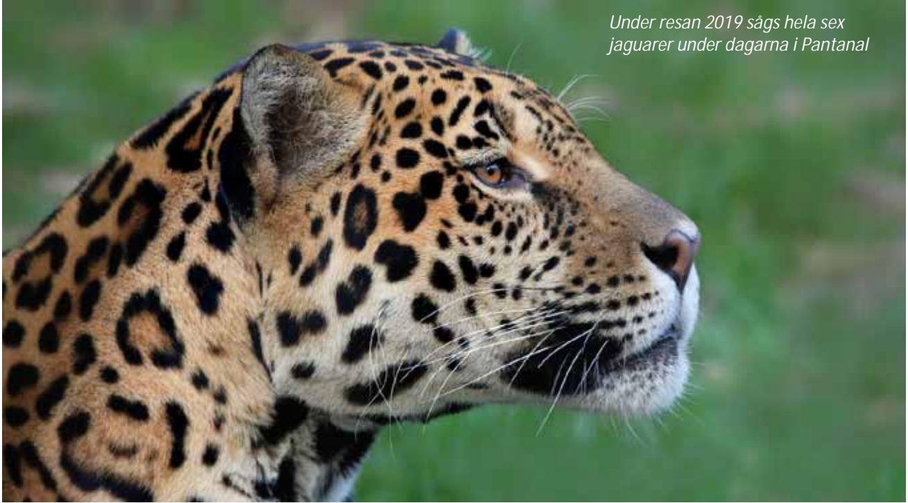
Under resan 2019 sågs hela sex jaguarer under dagarna i Pantanal