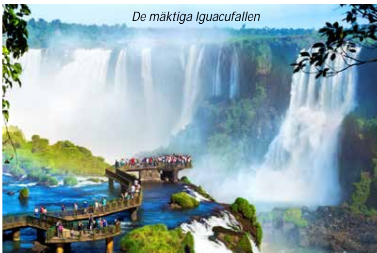
De mäktiga Iguaçu-fallen

En fantastisk dag väntar idag! Den stora attraktionen här är de enorma vattenfallen. Iguaçu-fallen, som inte bara är ett fall utan mängder av vattenfall i olika storlekar, är över tre kilometer breda och mer än 80 meter höga. Detta gör dem bredare än Victoriafallen, högre än Niagara och absolut mer imponerande än något av dessa. I vattenmängd är Iguaçu det största vattenfallet i världen, och ett besök här är en av höjdpunkterna på en Brasilienresa. Iguaçu-fallen delas mellan Argentina och Brasilien, och ni kommer under dagen se fallen från båda sidorna. Den brasilianska sidan bjuder mäktigare