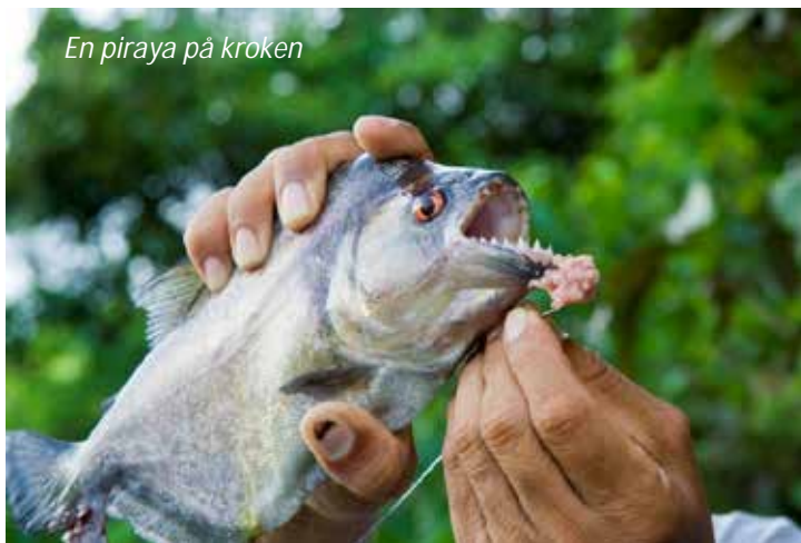
En piraya på kroken

Efter frukost ger vi oss ut tillsammans med en kunnig guide för att utforska regnskogen. Det som många reagerar över vid sitt första besök i regnskogen är att man ser relativt lite djur, men i gengäld hör desto mer! Djungeln är aldrig tyst, när vrålapor och trädgrodor tystnar för dagen, tar cikador och nattens djur över. Om vi har tur och går tyst har vi ändå goda chanser att se många av de djur som lever i djungeln, framför allt fåglar och apor. Efter lunch på lodgen, varefter vi har ett par timmar ledig tid för vila, åker vi ut på en fisketur på floden. Guiden kommer att lära oss mer om den enorma mångfalden av fisk och även själva