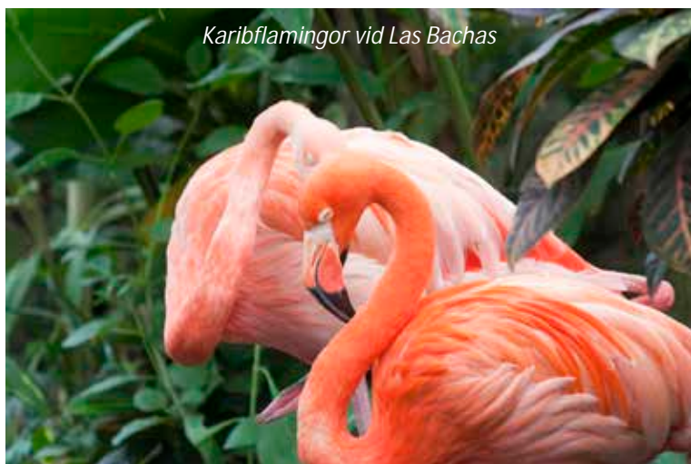
Karibflamingor vid Las Bachas

Efter frukost går vi iland på den vackra stranden Las Bachas på den norra sidan av Santa Cruz. Detta är en av de viktigaste ägglägningsplatserna på Galápagos för den gröna havssköldpaddan och vi har också goda möjligheter att se flera arter av vadarfåglar, bland annat flamingor i de små lagunerna som vi promenerar till. Vi ser även havsleguaner och de överallt närvarande Sally Lightfoot-krabbor. Dessa vackert färgade krabbor, orangeröda på ovansidan och ljusblå på undersidan, börjar dock sitt liv som lavafärgade för att smälta in bland klipporna. På eftermiddagen väntar oss