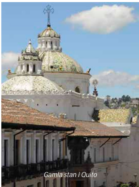
Gamla stan i Quito

Vi flyger på morgonen med KLM från antingen Stockholm, Göteborg, Linköping eller Köpenhamn till Amsterdam, där vi byter plan. Vi ber er observera att priset är baserat på resa från Stockholm och att det eventuellt kan bli pristillägg vid avresa från andra orter, beroende på skatter och platstillgång. Härifrån går sedan flyget direkt till Quito, där vi landar sent på eftermiddagen lokal tid, möts vid ankomsten och körs till vårt hotell som ligger mycket centralt i den nya delen av staden. Resten av dagen är ledig för att akklimatisera oss efter den långa resan och anpassa oss till den höga höjden: Quito är världens näst högst belägna huvudstad på 2 850 meters höjd.