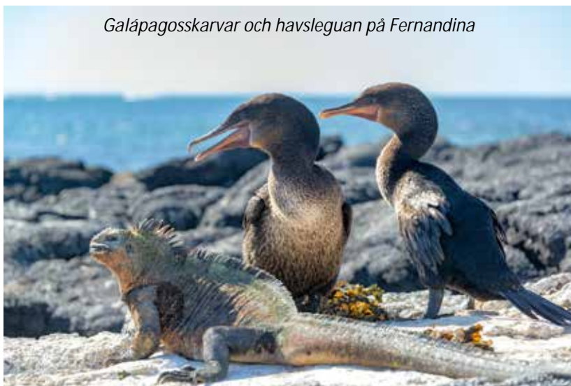
Galápagosskarvar och havsleguan på Fernandina

Vi börjar dagen vid Punta Espinosa, den enda öppna besöksplatsen på Galápagos västligaste och yngsta ö, Fernandina. Då Fernandina är en så pass ny ö, endast cirka 700 000 år gammal, så ändras landskapet ständigt. Så sent som 1968 kollapsade kratern och sjönk mer än 300 meter! Här går vi en promenad genom det nästan surrealistiska lavalandskapet och ser ögruppens största koloni av havsleguaner och om vi inte såg Galápagosskarv igår så gör vi det nästan garanterat idag. Efter promenaden så har vi möjlighet att snorkla från