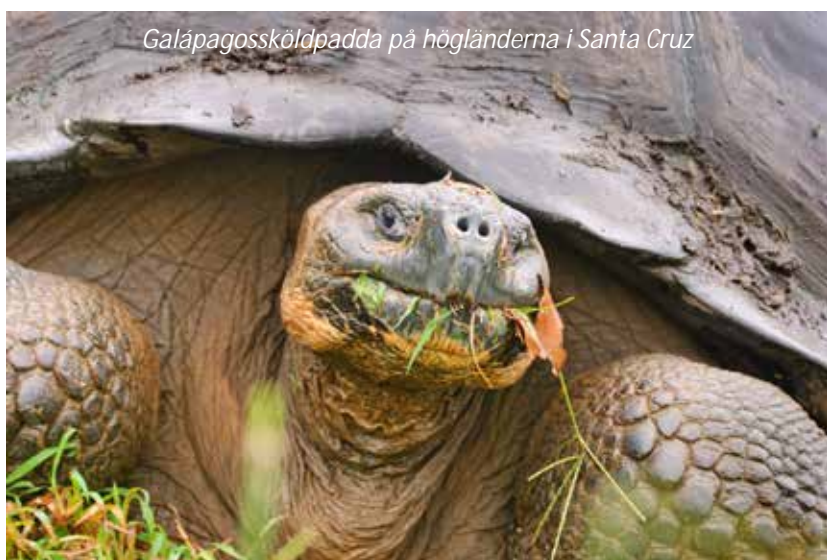
Galápagosköldpadda på högländerna i Santa Cruz

Under åtta fantastiska dagar kommer vi att kryssa runt bland de olika öarna i Galápagosarkipelagen. Vi kommer att gå efter annan slås av den enorma variationen både vad gäller djur- och växtliv. Även landskapet uppvisar en fantastisk variation, från Genovesas surrealistiska vulkanlandskap till regnskogen på Santa Cruz högländer. Men, naturligtvis, höjdpunkten för de flesta är djuren. Dessa djur som i många fall inte finns någon annanstans och som bara ligger framför fötterna på oss - helt orädda! Den som har lekt med sjölejon i vattnet, sett blåfotade sulors roliga och intressanta häckningsdans eller sett fregattfågeln blåsa upp sina röda strupsäckar glömmet det aldrig. Flyget från Quito går på morgonen och efter att ha