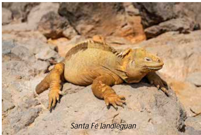
Santa Fé landleguan

Vi börjar dagen med att besöka Cerro Dragón på den norra sidan av ön Santa Cruz. Namnet betyder drakkullen och kommer sig av den stora populationen av Galápagos landleguaner, på svenska även kallade drushuvudödlor. Denna leguanart kan bli upp till 120 cm lång och är en av tre endemiska leguanarter på Galápagos. Förutom leguanerna har vi möjlighet att se Galápagoshärmfågel, lavahäger och i de små lagunerna även vackert rosafärgade flamingor. Under vår båttur längsmed stranden har vi även chans att se hajar, rockor och havssköldpaddor. De två andra arterna av leguaner har vi goda