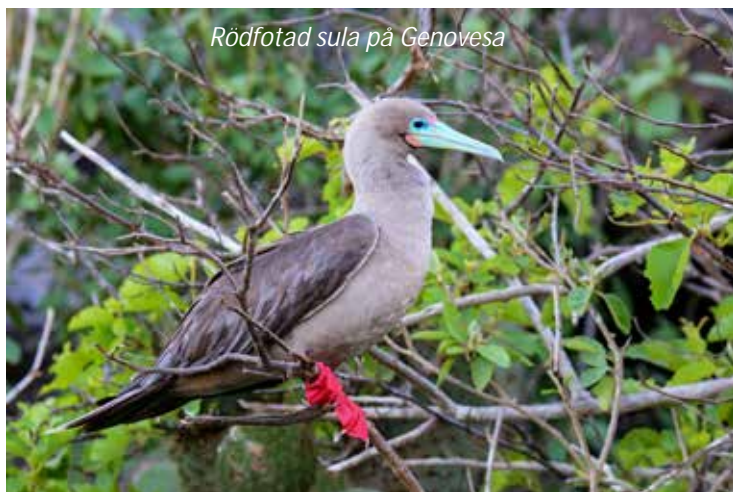
Rödfotad sula på Genovesa

Under natten har vi korsat ekvatorn och stävat norrut till den spektakulära ön Genovesa. Denna lilla ö är känd som Fågelön och den gör verkligen skäl för sitt smeknamn. Här finns två besöksplatser och på förmiddagen besöker vi Prince Philips Steps. På vägen uppför klippan så har vi möjlighet att se rödfotad sula, som endast lever på de nordliga öarna, fregattfågel, Galápagosduva, rödnäbbad tropikfågel, svalstjärtad mås, som är den enda måsarten i världen som är nattaktiv och anses som kanske världens vackraste mås, och den endemiska lavamåsen, som är världens