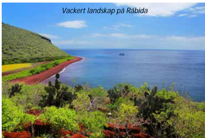
Vackert landskap på Rábida

Dagens första landstigning gör vi vid Puerto Egas på ön Santiagos västra kust. Detta är en av de absolut bästa platserna att se Galápagospälssäl. Denna art är mindre än sjölejonen och har, som namnet antyder, en mycket tjock och fin päls vilket ledde till att den jagades så omfattande att man länge trodde att arten var utdöd. 1932 upptäcktes den på nytt och efter skyddsåtgärder så finns det idag uppskattningsvis hela 35000 individer. Här kan vi även se bland annat brun pelikan, blåfotad sula, gulkronad natthäger och amerikansk strandskata förutom gott om havsleguaner och Sally Lightfoot-krabbor.