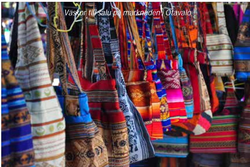
Väskor till salu på marknaden i Otavalo

Idag är det lördag och vi kommer att njuta av en av Latinamerikas absolut mest kända och sevärda marknader, lördagsmarknaden i Otavalo! Vi börjar tidigt på morgonen med ett guidat besök på djurmarknaden utanför staden. Hit kommer människor från kringliggande byar för att köpa och sälja boskap, det är ett härligt folkliv när man diskuterar priser på får, grisar, kor och hästar. Vi åker sedan tillbaka till Otavalo, där vi har dagen ledig för att på egen hand gå runt på den enorma marknaden. Det är inte bara