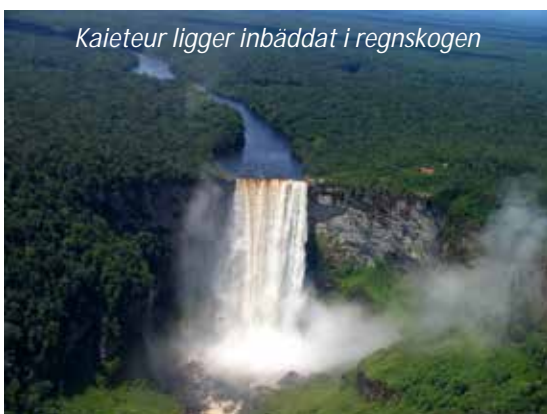
Kaieteur ligger inbäddat i regnskogen

En fantastisk utflykt väntar oss idag! Vi hämtas efter frukost på hotellet och körs till flygplatsen för att flyga söderut. Resan går över Guyanas mäktiga regnskog så ha kameran redo, det finns gott om tillfällen till vackra fotografier. När vi kommer fram till Kaieteur så tar piloten en extra runda för att ge oss en oförglömlig utsikt över detta mäktiga vattenfall, som med sina 226 obrutna meter är ett av världens högsta - till exempel fem gånger högre än Niagarafallen och mer än dubbelt så högt som Victoriafallen. Minst lika imponerande är naturen runt omkring fallet, som består av primär regnskog (primär innebär att den aldrig har varit nedhuggen, sekundär att