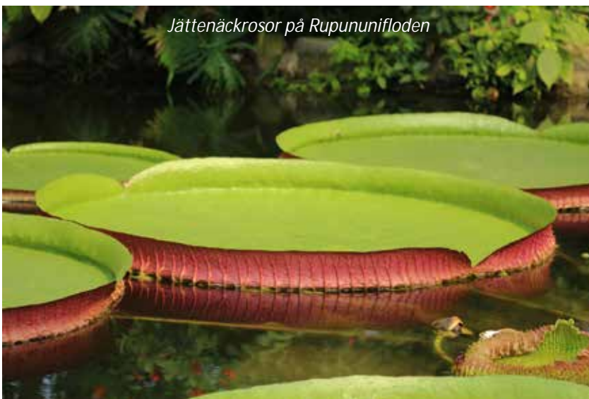
Jättenäckrosor på Rupununifloden

Om vi inte såg någon jättemyrslok igår så ger vi oss ut igen på savannen på morgonen för att se om vi kan göra det idag istället. Under dagen kommer vi även att ta en båtutture på Rupununifloden för