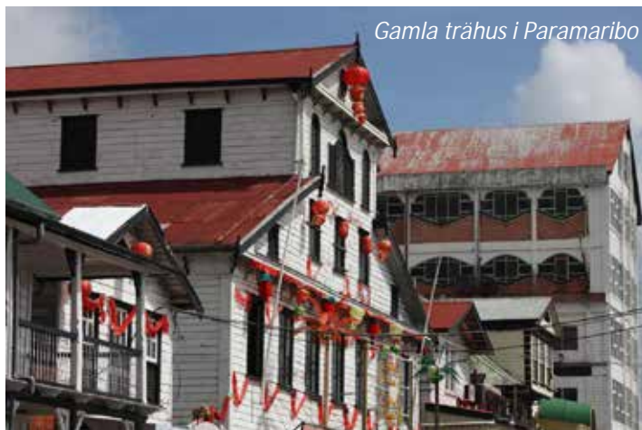
Gamla trähus i Paramaribo

Efter en ledig förmiddag så ger vi oss ut på en stadsrundtur i denna intressanta stad. Det var britterna som grundade staden 1630 och 1650 blev Paramaribo huvudstad för Brittiska Guyana. Området skiftade sedan styre många gånger mellan britterna och holländarna, men från 1815 och fram till självständigheten 1975 styrdes Surinam från Holland. Trots ett par stora eldsvådor under 1800-talet så finns många vackra trähus i typisk holländsk och brittisk kolonialstil kvar och 2002 sattes Paramaribos stadskärna upp på Unescos lista över världsarv. Vi utforskar staden både med bil och till fots och ser de främsta sevärdheterna, som Fort Zeelandia, presidentpalatset, självständighetstorget med mera. Eco Torarica (3*). Frukost.