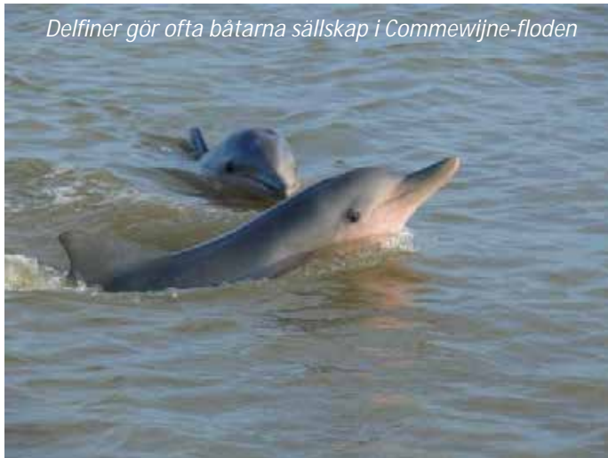
Delfiner gör ofta båtarna sällskap i Commewijne-floden

Vi ger oss idag ut för att utforska Paramaribos vackra omgivningar. Vi åker österut till Commewijnedistriktet och ser längs vägen flera gamla plantager från kolonialtiden, varav de flesta idag är övergivna. Vi stannar vid en av de äldsta, Peperpot. Denna är fortfarande i näst intill ursprungsskick och vi tar en tur i den gamla gårdsbyggnaden samt på ägorna, där vi ser kaffe- och kakaobuskar. Besöket här ger en fascinerande inblick i hur livet såg ut på 1700- och 1800-talen, då stora mängder slavar fördes från Afrika hit för att arbeta under hemska förhållanden på plantagerna. När slaveriet avskaffades på senare hälften av 1800-talet, kom istället många arbetare från andra