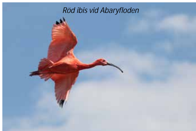
Röd ibis vid Abaryfloden