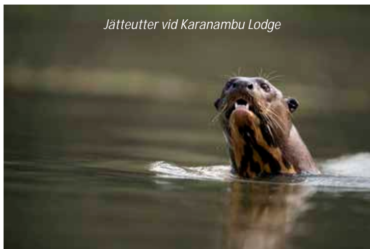
Jätteuttrar vid Karanambu Lodge