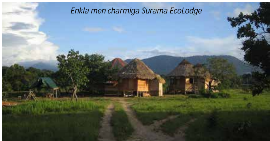
Enkla men charmiga Surama EcoLodge

Vi går upp tidigt på morgonen för att ta en båtutflykt längs floden. Vi spanar efter jätteuttrar, svarta kajmaner och färgglada tukaner bland mycket annat! Vi kommer sedan åter till lodgen för frukost. Sedan lämnar vi Iwokrama och fortsätter resan mot Surama - håll ögonen öppna under resan då denna sträcka är känd för att vara en av de bästa i Guyana för att se jaguar. Naturligtvis krävs det dock mycket tur för att se detta