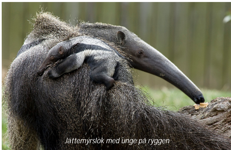
Jättemyrslok med unge på ryggen

På morgonen ger vi oss ut på de böljande gräsmarkerna i närheten av lodgen för att skåda efter jättemyrslok - som namnet antyder är detta den största arten av de fyra arterna av myrslokar och kan väga upp emot 40 kilo. Området runt Karanambu är en av de bästa platserna att se detta säregna djur, som lever helt och hållet på myror och termiter. De gräver hål i termitstackarna där de sedan stoppar in sin långa och klubbiga tunga som termiterna fastnar på. Hanarna kan faktiskt bli mer än två meter långa. Vi