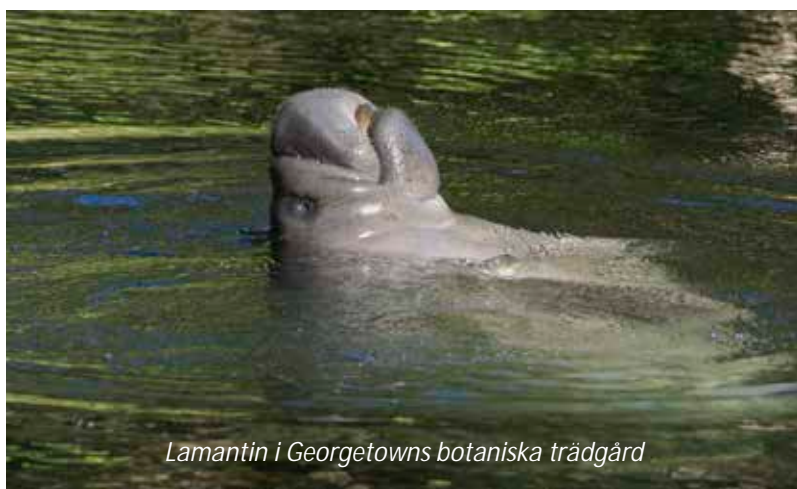
Lamantin i Georgetowns botaniska trädgård

Vi åker ut till flygplatsen efter en tidig frukost för att flyga västerut till Georgetown, huvudstad i grannlandet Guyana. Här möts vi och körs till vårt centralt belägna hotell. Georgetown har idag cirka 240 000 invånare, inklusive förorter, och är Guyanas enda större stad. Namnet Guyana kommer från ett indianskt ord som betyder "vattnens land", vilket stämmer alldeles förträffligt då Guyana är ett av världens tio vattenrikaste länder. Under eftermiddagen kommer vi sedan att