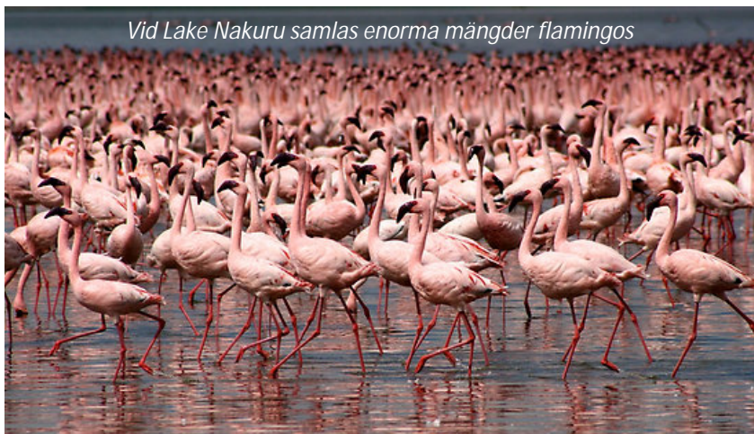
Vid Lake Nakuru samlas enorma mängder flamingos

Ni hämtas på hotellet efter frukost och körs västerut till er lodge som ligger i den vackra nationalparken Lake Nakuru. Denna sjö är, tillsammans med två närliggande sjöar, uppsatt på Unescos världsarvslista sedan 2011. På vägen stannar ni för att ta in de mäktiga vyerna över Great Rift Valley, dvs den stora förkastningsspricka som löper genom den västra