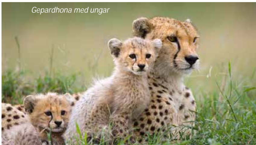
Gepardhona med ungar

Dagens första gamedrive i Masai Maras nationalpark startar i gryningen, då djur och fåglar är som mest aktiva, och ni kommer att få uppleva möten med ett flertal däggdjursarter från er safarijeep. Två permanenta floder skär genom landskapet: Marafloden och Talekfloden. Längs Marafloden finns ett antal platser där de vandrande hjordarna