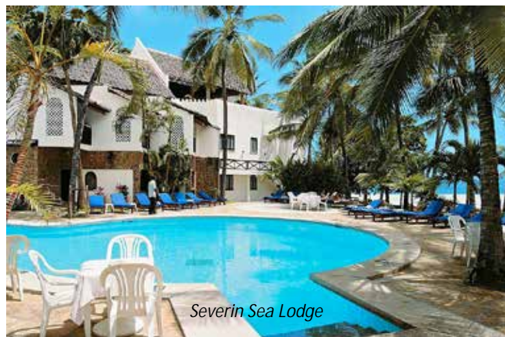
Severin Sea Lodge

Ni lämnar idag Masai Mara, men passar naturligtvis på att spana efter djur och fåglar på väg ut genom nationalparken. Ni körs sedan direkt till flygplatsen utanför Nairobi, varifrån ni flyger till Mombasa vid kusten. Ni möts vid ankomsten och körs direkt till Bamburi Beach, som ligger 20 km från flygplatsen och 12 km norr om Mombasa. Här väntar er några härliga avkopplande dagar vid den kritvita stranden!