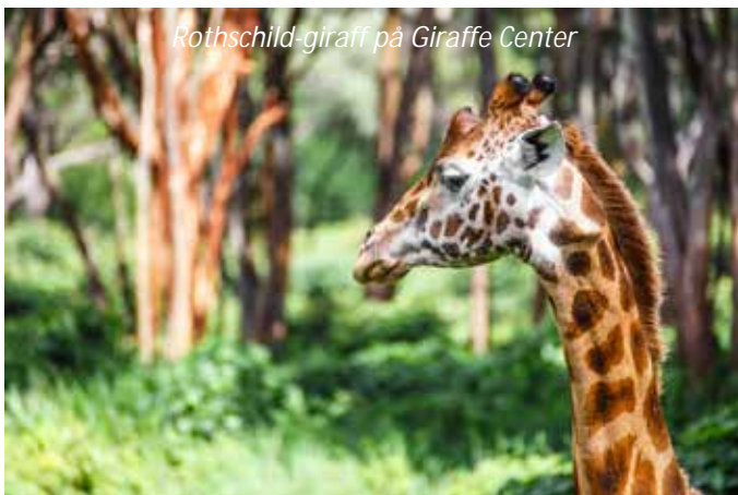
Rothschild-giraff på Giraffe Center

Ni landar i Nairobi, Kenyas huvudstad, på morgonen. Ni möts vid ankomsten och körs till hotellet, där ni har tillgång till ert rum direkt vid ankomsten. Efter en ledig förmiddag för att vila ut efter den långa resan så hämtas ni på hotellet för en utflykt till Giraffe Center. Detta grundades för att föda upp och säkra beståndet av den utrotningshotade Rothschild-giraffen. Runtom centret finns även ett rikt fågelliv och många halvtama vårtsvin! Tillbaka i Nairobi så ingår en middag på en av stadens mest välkända restauranger,