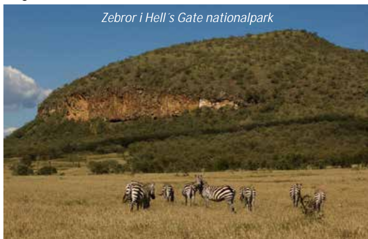
Zebror i Hell's Gate nationalpark

Efter en tidig väckning och lätt förtäring gör ni er klara för morgonens första gamedrive. Lake Nakuru utlystes ursprungligen till nationalreservat för att skydda dess rika fågelliv. Bland fågelarterna som lever i parken – förutom flamingos – kan nämnas vit och rosaryggad pelikan, ormhalsfågel, stork, ibis och en mängd rovfågelarter. Sjön hålls även för att vara ett av landets bästa ställen att se lejon, flodhäst, östlig svartvit guereza (långhårig art av apa) och ett flertal antiloparter.