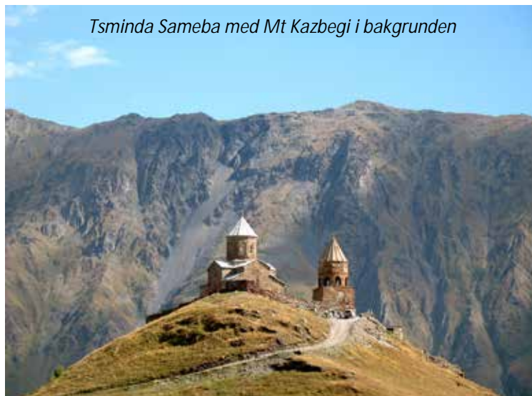
Tsminda Sameba med Mt Kazbegi i bakgrunden

Ni lämnar Tbilisi bakom er och körs norrut. Efter bara en halvtimmes resa når ni Mtskheta, Georgiens gamla huvudstad, som ligger där floderna Mtkvari och Aragvi möts. Staden är nästan 4 000 år gammal och är en av världens äldsta kontinuerligt bosatta städer. Mtskheta var huvudstad mellan 500 f Kr och 500 e Kr, då Tbilisi tog över denna roll. Staden är dock fortfarande något av Georgiens religiösa huvudstad och ni besöker landets viktigaste katedral, Sveti-Tskhoveli, som byggdes i början av 1000-talet. Här ligger många av