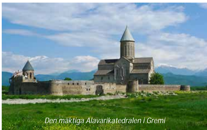
Den mäktiga Alavarikatedralen i Gremi

Efter frukost åker ni till det antika Gremi som var huvudstad under 1500- och 1600-talet i det dåvarande kungadömet Kakheti. Den var känd som en livlig handelsplats och en del av dåtida Sidenvägen, innan den förstördes av perserna 1615 för att därefter aldrig återfå sin betydelse som viktig knutpunkt i regionen. Gremiborgen och Ärkeänglarnas kyrka ligger vackert på en höjd med utsikt över de många vingårdarna som ligger tätt i landskapet nedanför. Ni ser även