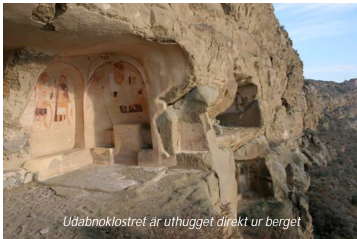
Udabnoklostret är uthugget direkt ur berget

Vi törs lova att dagens första attraktion kommer att bli en av resans absoluta höjdpunkter: David Gareja-klostret. Detta magnifika kloster grundades av en man med samma namn, en av de 13 syriska fäderna, på 500-talet. De höggs ut ur kalkstensklipporna vilket ger hela klosterområdet en närmast överklig känsla. Strax efter grundandet så blev David Gareja ett viktigt pilgrimsmål, då det sades att en tredjedel av Jerusalems andliga skatter förvarades här. Även om David Gareja i sig är imponerande, så väntar det bästa på