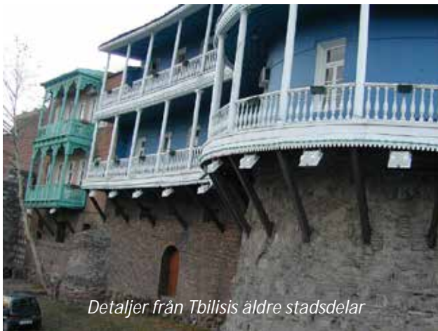
Detaljer från Tbilisis äldre stadsdelar

Ni landar i Tbilisi, Georgiens huvudstad, på natten. Ni möts vid ankomsten och körs till ert hotell, som ligger mycket centralt. Efter några välbehövliga timmars morgonvila hämtas ni för en stadsrundtur i denna intressanta och mycket charmiga stad. Det är förvånande att så mycket finns kvar av Tbilisis äldre stadsdelar; staden har plundrats och erövrats runt 30 gånger de senaste 1 500 åren. Tbilisi, som var en viktig knutpunkt längs Sidenvägen, ligger väldigt vackert, i en dalgång med floden Mtkvari rinnande genom staden. Ni kommer att se både de moderna och gamla stadsdelarna, samt besöka historiska museet