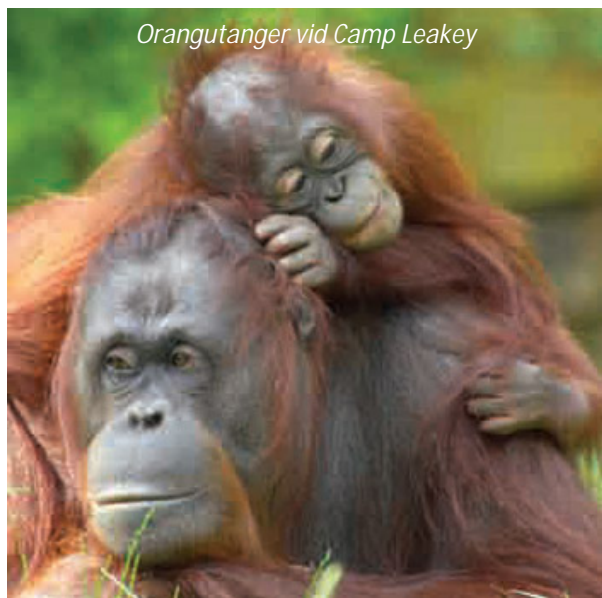
Orangutanger vid Camp Leakey

Idag åker ni till Camp Leakey, som grundades 1971 av den kanadensiska forskaren Biruté Galdikas. Här får unga orangutanger, som tidigare varit tillfångatagna eller fått sina mödrar dödade, lära sig att leva i frihet. De söker sig längre och längre från forskningscentret, men eftersom de vant sig vid människor så blir de aldrig helt vilda igen, utan kommer då och då tillbaka till centret för att få mat – något som ni får vara med om idag, när ni går med personalen till matplatsen och ser orangutangerna komma dit för att få dagens ranson av mjölk och frukt. Orangutangernas låga nativitet, en hona får i genomsnitt en unge var åttonde år, gör att de fortfarande är utrotningshotade, trots ansträngningar från institutioner som Camp Leakey. Under båtresan till och från centret, har