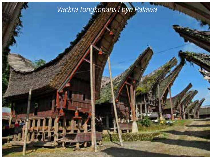
Vackra tongkonans i byn Palawa

Ni besöker idag byar norr om Rantepao. Första byn är Palawa med många vackra tongkonan och mindre rislador, som går i samma stil. Ni fortsätter sedan till Sa'dan, en by som är känt för sina väverier, och fortsätter sedan till Batutumongo, som ligger på hela 1 300 meters höjd. Här äter ni lunch och ser sedan de 56 resta menhir -stenarna, som är placerade i en cirkel. Det är tradition här att resa en menhir när en familjemedlem dör. Ju viktigare familjemedlem och rikare familj, desto större menhir . I Lokomata ser ni klippgravar dramatiskt belägna på