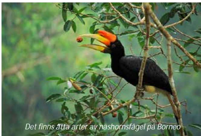
Det finns åtta arter av näshornsfågel på Borneo

Ännu en dag i denna fantastiska nationalpark! Ni stävar längre in än de flesta kommer och därför är också möjligheterna att se såväl orangutanger som andra arter större än annars. Ni gör flera stopp för vandringar i regnskogen under dagen. Under dagarna här kommer ni verkligen att se att Borneo kan uppvisa en av världens största biologiska mångfalter. Enligt Världsnaturfonden så har ön sju ekoregioner, omkring 15 000 växtarter varav 3 000 trädarter, 221 arter landdäggdjur och 420 arter av häckande fåglar – nästan dubbelt så många som i Sverige! Det finns flera endemiska eller halvendemiska (endemisk är en art om den endast lever inom ett begränsat område) arter; orangutang samt mycket sällsynta arter som trädleoparden, asiatisk elefant och Sumatranoshörning.