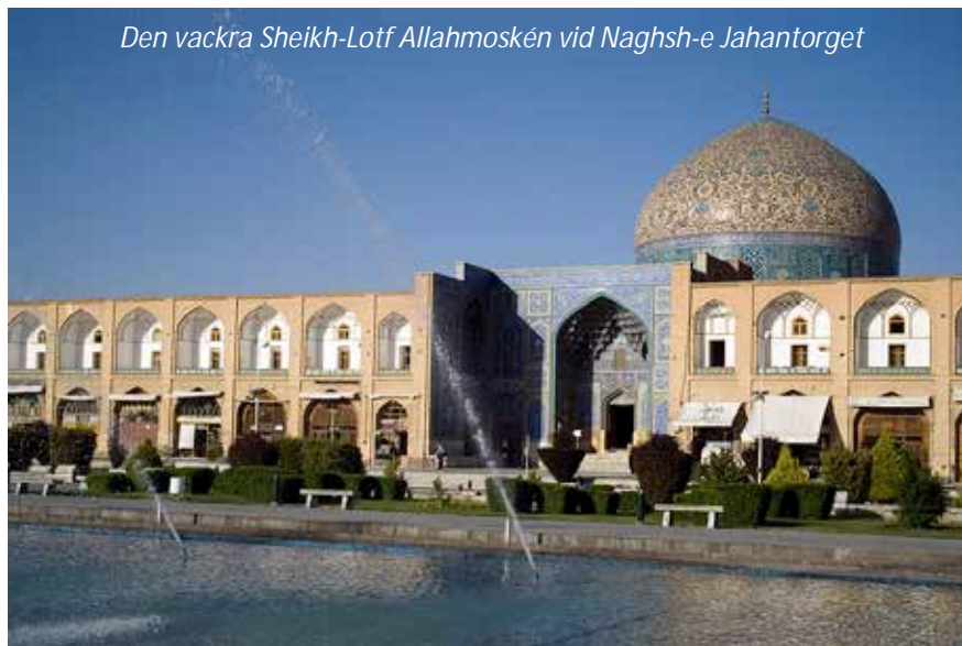
Den vackra Sheikh-Lotf Allahmoskén vid Naghsh-e Jahantorget

Ni kommer idag att göra en stadsrundtur i denna vackra stad. Isfahan är utan tvekan den stad som bäst representerar persisk arkitektur och hantverk. "Isfahan är halva världen" lyder ett gammalt talesätt som visar på stadens betydelse, dels som persisk huvudstad under safaviderna och dels för det strategiska läget vid den gamla karavanvägen mellan Persiska viken och Teheran. Dessutom