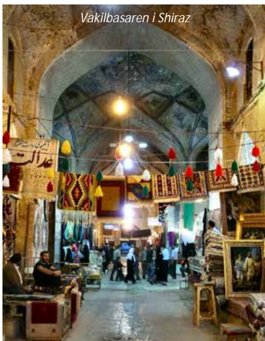
Vakilbasaren i Shiraz