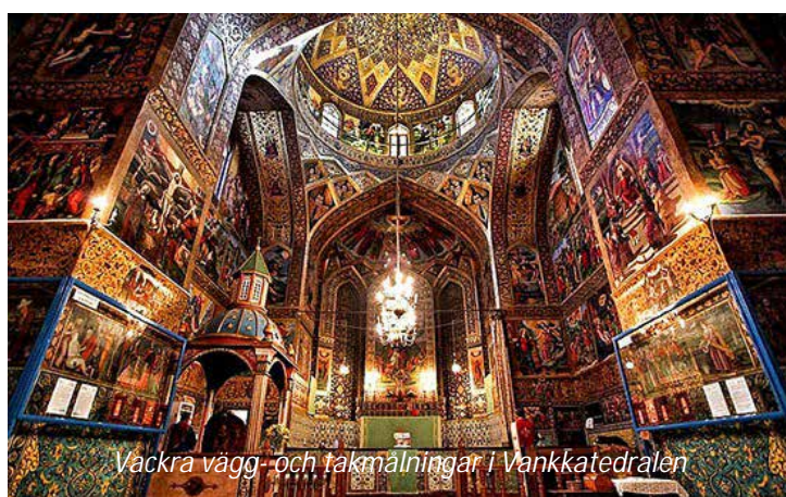
Vackra vägg- och takmålningar i Vankkatedralen

Er stadsrundtur i Isfahan fortsätter på morgonen då ni först besöker Vankkatedralen i stadsdelen Djolfa. Denna katedral uppfördes under Kung Shah Abbas I till förmån för de många armeniska immigranter som varit på flykt efter Ottomanska kriget, 1603-1605. Armenierna har full frihet att utöva sin kristna religion mitt inne i det annars islamska Iran. Katedralen är en blandning av islamisk-persisk och kristen-europeisk stil och de dekorativa interiörerna är magnifika!