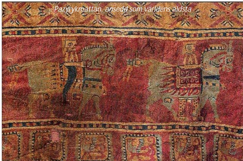
Pazyrykmattan, ansedd som världens äldsta

huvudstadens verkliga höjdpunkter, National- museet. En stor del av den imponerande samlingen av antika föremål som kan skådas på museet är från det fjärde och femte århundradet f Kr och innefattar utsökt bearbetade stenfigurer och kilskriftstavlor, lergods, vackra keramikföremål och mycket mer. Ni fortsätter med att utforska huvudstadens berömda mattmuseum, som