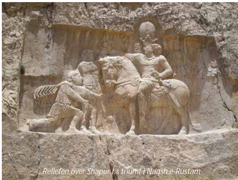
Reliefen över Shapur I:s triumf i Naqsh-e-Rustam

Kyros II:s mausoleum, fästningen Toll-e Takht och lämningarna efter två kungliga palats och deras trädgårdar. Härifrån fortsätter ni färden till en av resan absoluta höjdpunkter; den närliggande staden Persepolis, också den uppsatt på Unescos världsarvslista. Persepolis blev aldrig helt klart och byggandet höll på ända fram till att perserriket erövrades 331 f Kr av Alexander den Store, som delvis lät förstöra staden. De arkeologiska lämningarna från det stora palatskomplexet och, framför allt, de många