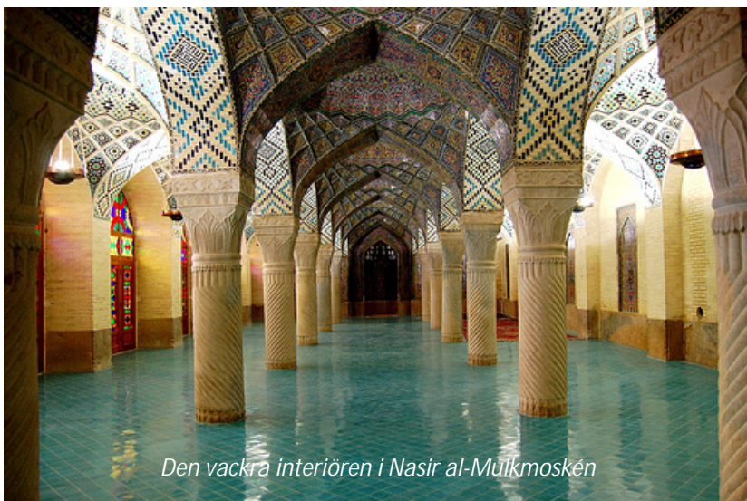
Den vackra interiören i Nasir al-Mulkmoskén

Inom basarområdets äldsta delar finner man givetvis också de traditionella badhusen som varmt rekommenderas för ett besök. Ni fortsätter till Karim Kahnborgen, som uppfördes 1766 under Zanddynastin och som fått sitt namn efter den dåtida härskaren. Detta imponerande medeltids-