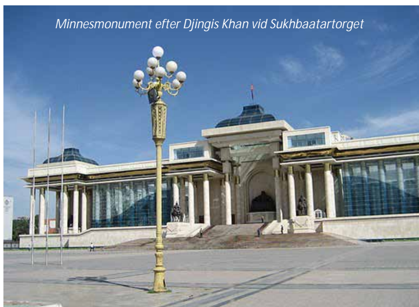
Minnesmonument efter Djingis Khan vid Sukhbaatarorget

Ni landar i Ulan Bator, Mongoliets huvudstad, på morgonen. Ni möts vid ankomsten och körs till ert hotell, som ligger mycket centralt. Efter ett par lediga timmar för att ta igen er efter den långa resan, hämtas ni för en stadsrundtur vid lunchtid. Ni börjar med att åka upp till berget Zaisan, för att njuta av den vackra utsikten över huvudstaden, och fortsätter sedan ner till huvudtorget Sukhbaatar och avslutar på det naturhistoriska museet,