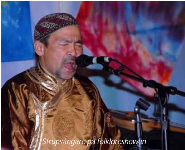
Strupsångare på folkloreshowen

Efter frukost åker ni tillbaka till Ulan Bator. Eftermiddagen är ledig för egna aktiviteter och på kvällen väntar en riktig höjdpunkt, en folkloreshow där ni kommer att få se och höra en mongolisk specialitet; strupsång! Det går inte att beskriva hur det låter, det måste upplevas.