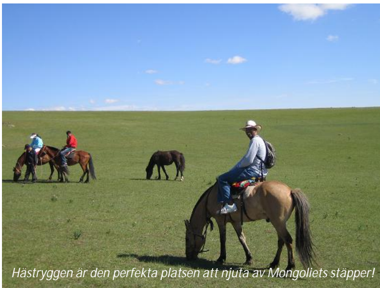
Hästryggen är den perfekta platsen att njuta av Mongoliets stäpper!

Ni fortsätter er ridtur på den enorma stäppen. Hann ni inte med att besöka en nomadfamilj igår, så kan ni göra det idag istället. Eftersom de konstant flyttar runt, så är det svårt att veta var man kommer att träffa dem. Gästfrihet är mycket viktigt för dessa nomader, vilket är förstäeligt; under sommaren är det varmt och skönt men på vintern blir det stundtals ner mot 30-40 minusgrader och då krävs det samarbete för att överhuvudtaget kunna överleva. När man blir inbjuden till en ger, så är det antal regler som måste