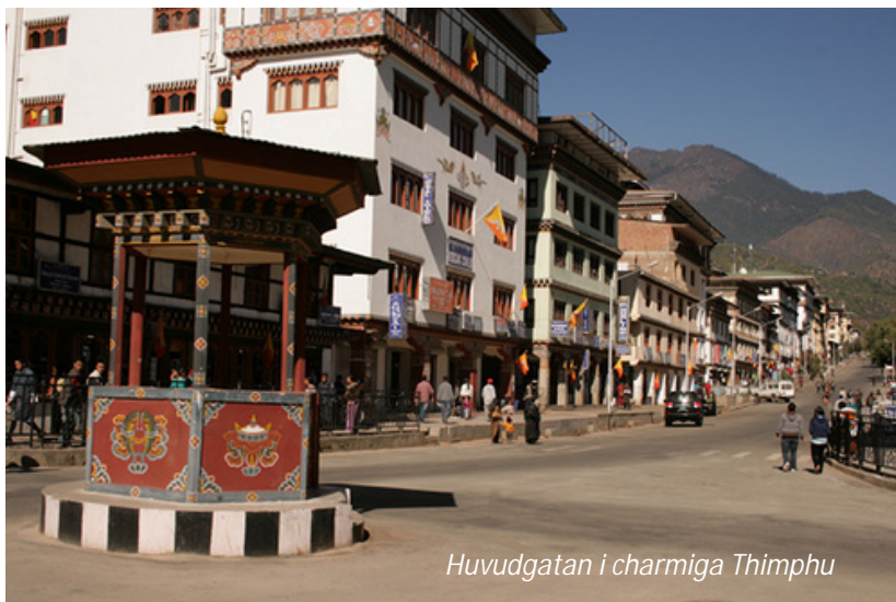
Huvudgatan i charmiga Thimphu

Hotel Phuntso Pelri (3*). Frukost, lunch, middag.