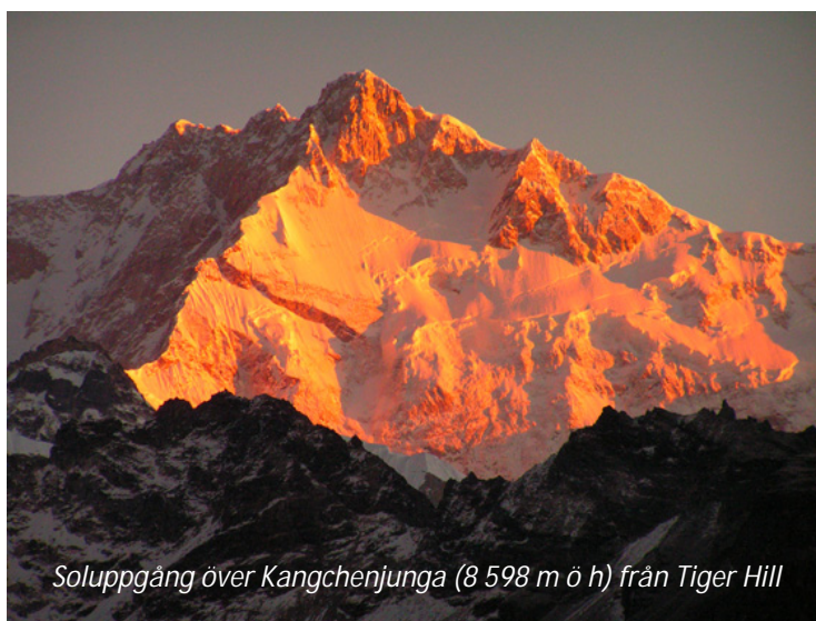
Soluppgång över Kangchenjunga (8 598 m ö h) från Tiger Hill

den 2 600 meter höga toppen åker ni smalspårigt ångloktåg, den sk Darjeeling Himalayan Railway , till Ghoomklostret. Under cirka en timmes färd bjuds ni på spektakulära vyer innan ni når slutstationen och klostret som ligger på sträckans högst belägna punkt. Tåget som har fått smeknamnet "leksakståget" är av Unesco listat som världsarv. Utsikten är oförglömlig – ni ser flera av världens högsta toppar, bland annat Mount Everest. I klostret, som uppfördes av en mongolisk munk och astrolog år 1875, bevaras värdefulla buddhistiska skrifter och byggnaden är det största av de tre i samhället Ghoom. Ni återvänder till Darjeeling i fyrhjulsdrivet fordon och på eftermiddagen besöker ni självhjälpscentrat för tibetanska flyktingar. De flyktingar som slog sig ner här startade centret, vilket är en av de äldsta i sin genre. Här driver man skolor för tibetanska barn, odlar organiska grödor, förestår klosterskolor och håller hantverkstraditioner levande, bland annat genom tibetansk mattillverkning.