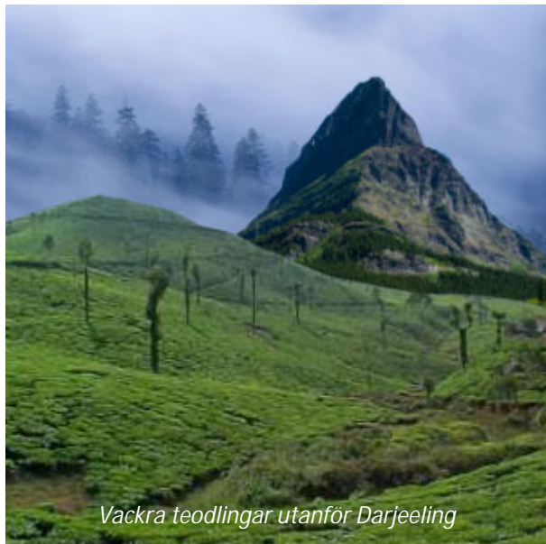
Vackra teodlingar utanför Darjeeling

Ni hämtas på hotellet på morgonen och körs till flygplatsen. Härifrån flyger ni norrut till den lilla staden Bagdogra, där ni möts och körs längs en vacker väg kantad av många teodlingar till Darjeeling. Resten av dagen är ledig för egna strövtåg i denna charmiga stad. Britternas närvaro sedan mitten av 1800-talet och den därefter expanderande teproduktionen har haft en framstående roll i utvecklingen av distriktet. Darjeelingteerna är berömda världen över för sin utmärkta kvalitet och mångskiftande smak.