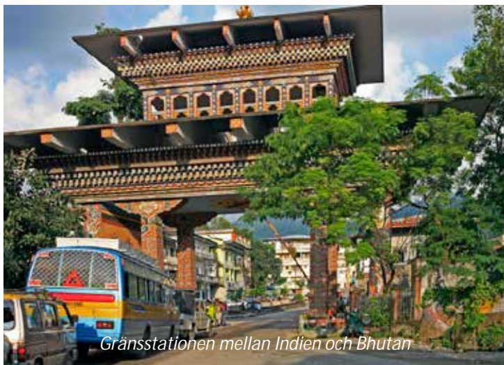
Gränsstationen mellan Indien och Bhutan

staden också ett viktigt centrum för tibetansk kultur. På eftermiddagen gör ni en stadsrundtur, där ni ser de viktigaste sevärdheterna. Snittblommor har blivit en viktig industri för denna del av Indien och ni gör ett besök i ett av växthusen för att få en förklaring till hur denna rätt komplicerade industri fungerar.