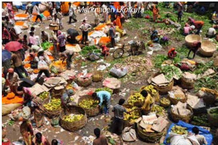
Marknaden i Kolkata

Efter en tidig frukost hämtas ni för att köras till flygplatsen i Paro varifrån ni flyger åter över gränsen till Indien och Kolkata. Passa på att njuta av Bhutan från ovan där vyerna är rent magiska; när ni flyger över bergskammen ut från Parodalen ser ni de många vackra husen klättra längs de gröna sluttningarna. Vid ankomsten möts ni och körs till ert hotell. Resten av dagen är ledig för egna promenader i denna jättestad.; besök gärna marknaden som är en orgie i färger och lukter!