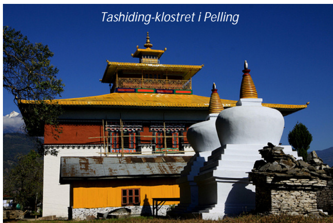
Tashiding-klostret i Pelling