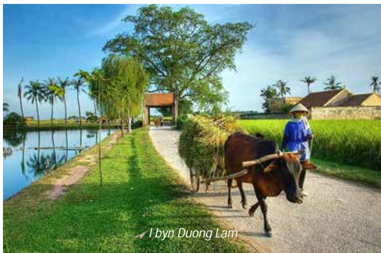
I byn Duong Lam

Idag börjar resan till de avlägset belägna norra bergstrakterna med sin fascinerande kultur. På vägen besöker ni byn Duong Lam, som är känt för sina många vackra, flera hundra år gamla, hus. Här tar ni en cykeltur och besöker flera familjer och får komma in hos dem för att få det dagliga livet beskrivet och även se insidan på de gamla husen. Ni besöker här också Mia-pagodan i byn och äter sedan en traditionell lunch i ett av de gamla husen. Ni fortsätter sedan till Mai Chau. Detta område domineras av den vita thaistammen,