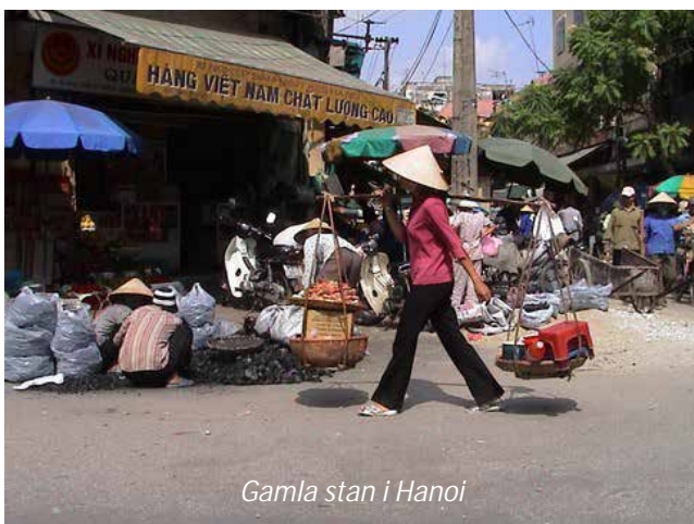
Gamla stan i Hanoi

Ni landar i Bangkok tidigt på morgonen och fortsätter härifrån efter par timmars väntan med Thai Airways till Hanoi, Vietnams huvudstad, där ni landar på förmiddagen. Ni möts vid ankomsten och körs till ert hotell, bra beläget i utkanten av de gamla kvarteren i Hoan Kiem. Hanoi är landets huvudstad sedan 1010 och landets andra stad i storlek med sina tre miljoner invånare. På eftermiddagen gör ni en kortare tur med cykeltaxi runt de gamla delarna av staden för att bekanta er med det lokala livet. Hanois gamla delar sjuder av liv och varje gata har sin specialitet, en kvarleva av det gamla skräsystemet.