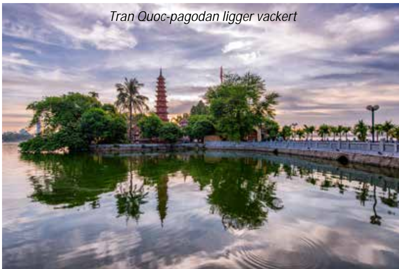
Tran Quoc-pagodan ligger vackert

Hotel Hong Ngoc Dynastie (3*). Frukost, lunch.