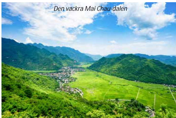
Den vackra Mai Chau-dalen

Enkel övernattnig i stylthus. Frukost, lunch, middag.