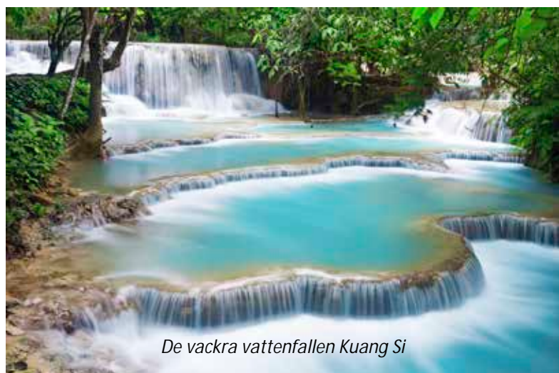
De vackra vattenfallen Kuang Si

Tidig uppstigning väntar idag, men en unik upplevelse väntar! Ni kommer att köras till ett kloster för att se hur traditionen med att ge mat till munkar fortfarande lever kvar i Laos. Invånarna kommer till klostret och delar ut ris direkt i munkarnas tallrikar, något som är unik i detta land men som tidigare var tradition i alla buddhistiska länder. Ni fortsätter sedan till morgonmarknaden nära det kungliga palatset, där man kan hitta allt från kokta grodor till färska grönsaker - marknader är alltid ett bra sätt att lära känna landet man