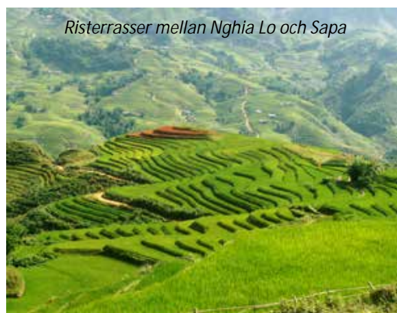
Risterrasser mellan Nghia Lo och Sapa

Eden Boutique Hotel & Spa (3*). Frukost, lunch.