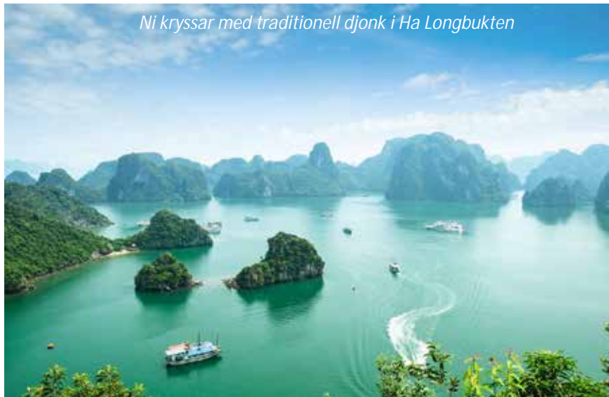
Ni kryssar med traditionell djonk i Ha Longbukten

Under dagarna i Ha Longbukten så kommer ni att gå ingå i en internationell grupp. Ni hämtas på hotellet på morgonen och körs österut till en av Vietnams, och hela Sydostasiens, främsta sevärdheter: Ha Longbukten med sin underbart vackra arkipelag. Här finns 1 969 öar vilka består av kalksten som är mycket porös. Vind och vatten har under århundraden format dessa fantastiskt formade öar som