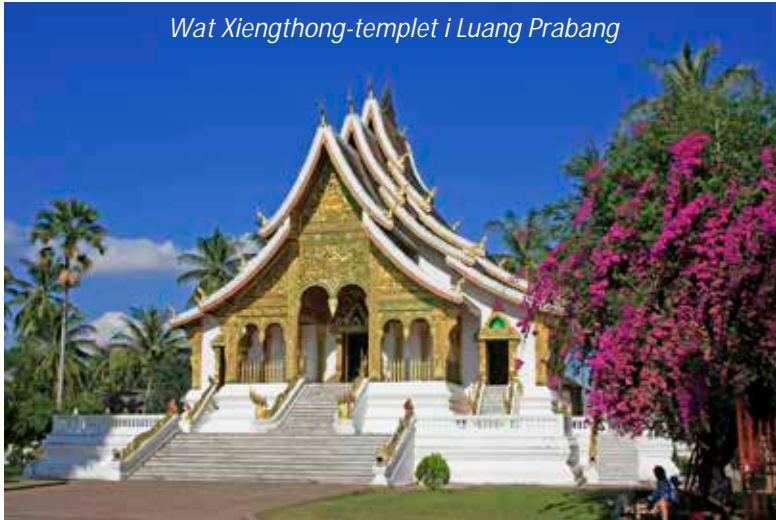
Wat Xiengthong-templet i Luang Prabang

Idag väntar en stadsrundtur som börjar med det kungliga palatsmuseet. Detta palats byggdes 1904 under den franska kolonialtiden åt Kung Sisavang Vong med familj. Platsen för palatset valdes ut så att besökare kunde gå av sina båtar precis nedanför palatset och där tas emot. När kommunisterna tog över Laos 1975 gjordes detta palats om till museum. Det har sedan dess bevarats precis om det såg ut när kungafamiljen lämnade och med tvång fördes till ett så kallat utbildningsläger. Ni