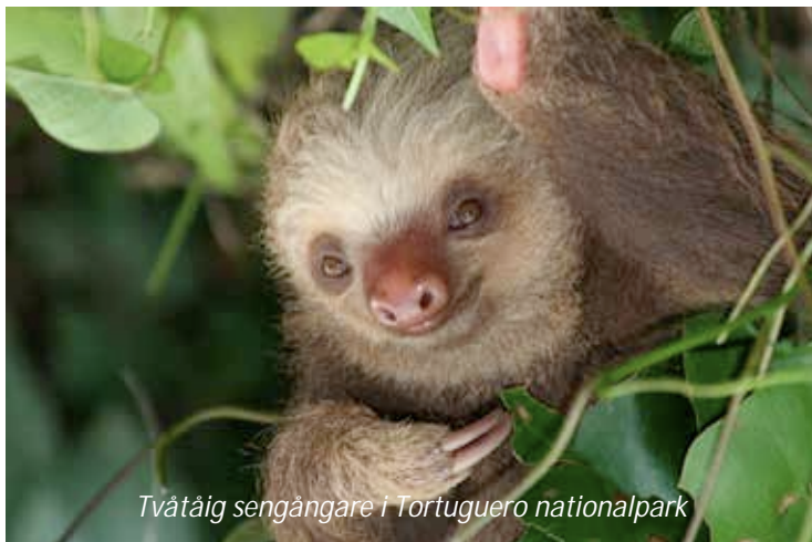
Tvåtåig sengångare i Tortuguero nationalpark

Tidigt på morgonen hämtas ni på hotellet och körs österut mot en av Costa Ricas mest intressanta nationalparker, Tortuguero. Resan går genom den spektakulära regnskogen i Braulio Carillo nationalpark, bara 30 minuter från San José. Efter ett par timmars resa byter ni till båt som tar er genom de slingrande kanalerna fram till er lodge. Under båtresan har ni er första möjlighet att njuta av denna nationalparks fantastiska flora och fauna. Tortuguero är endast 312 km 2 stor, men här lever nästan 400 fågelarter vilket är drygt 100 mer än i hela Sverige! Längs floden ser ni