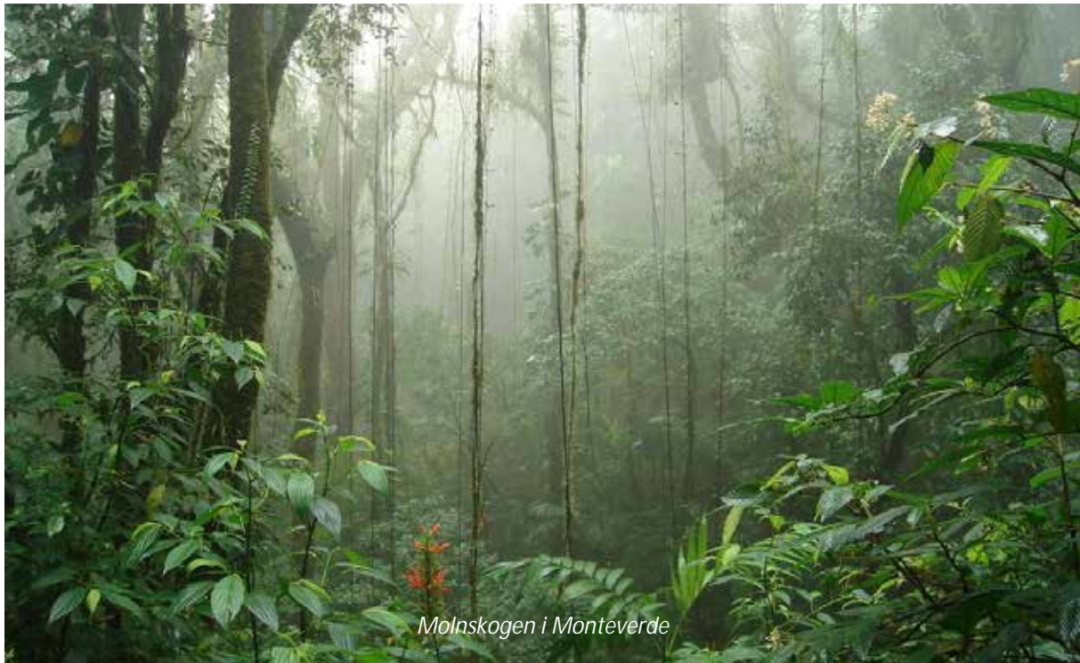
Molnskogen i Monteverde