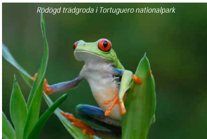
Rödögd trädgroda i Tortuguero nationalpark

Mawamba Lodge (3*). Frukost, lunch, middag.