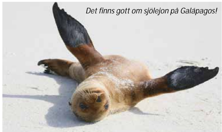
Det finns gott om sjölejon på Galápagos!

Galápagos är ett av de resmål som nästan alla har hört talas om och många drömmer sig till. Varför är inte så svårt att förstå – det är verkligen så som man tror att det är. För att gå iland måste man kliva över sjölejon som ligger och sover på klipporna, man måste gå runt ruvande fåglar på stigarna; Galápagos är ett unikt resmål för dig som är intresserad av djur och natur. Det mesta man ser runt sig är endemiskt, det vill säga finns bara här, och ingen annanstans i världen kommer man så nära djuren!