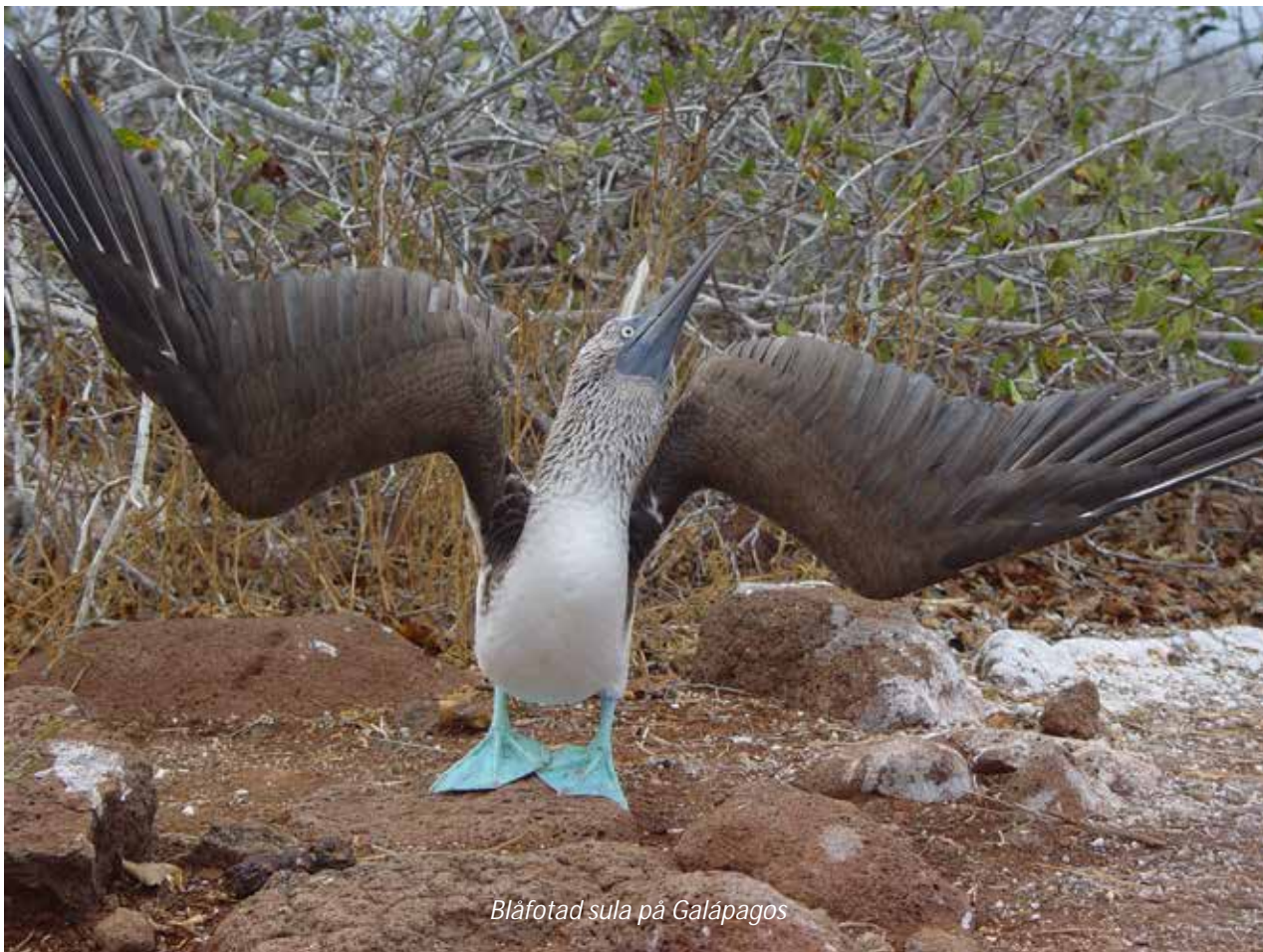
Blåfotad sula på Galápagos