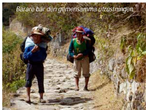
Bärare bär den gemensamma utrustningen