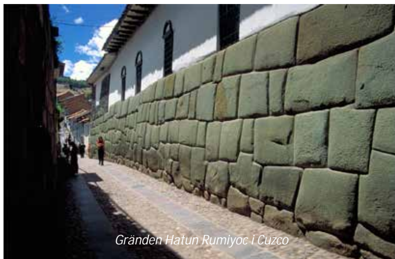
Gränden Hatun Rumiyoq i Cuzco

På morgonen körs ni till flygplatsen för att flyga till inkarikets gamla huvudstad, Cuzco. Vid ankomsten möts ni och körs till ert hotell. Resten av dagen är ledig för att på egen hand ströva runt i den underbara staden och vänja er vid den tunna luften. Tänk på att ta det lugnt denna första dag på hög höjd, Cuzco ligger på hela 3 310 meters höjd. Den bästa medicinen för att aklimatisera sig är att ta det lugnt med såväl alkoholhaltiga drycker som tobak, dricka mycket vatten och gärna vila ett par timmar efter ankomsten. På eftermiddagen rekommenderar vi ett besök vid huvudtorget Plaza de Armas och den närbelägna gränden Hatun Rumiyoq, där ni kan se den berömda 12-kantiga stenen! Här i närheten ligger även de mycket charmiga hantverkskvarteren San Blas. Hotel Plaza San Francisco (3*). Frukost, måltid ombord på planet.