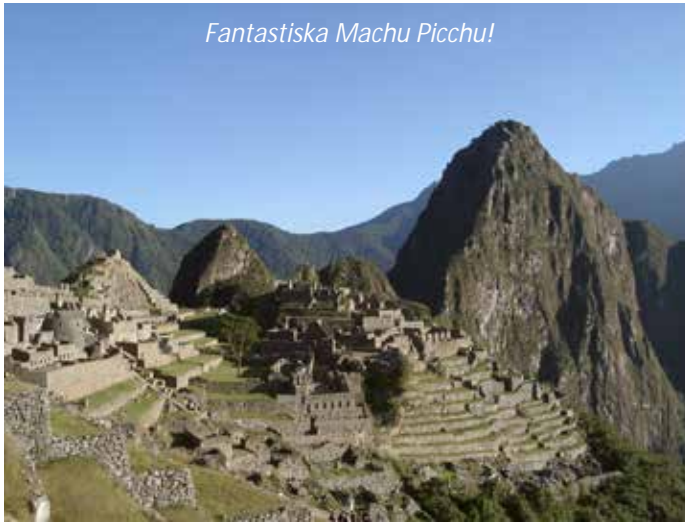
Fantastiska Machu Picchu!

Denna fjärde och sista dag går ni upp klockan 4.00 och lämnar Wiñaywayna en timme senare för den avslutande vandringen till solporten, Inti Punku, som tar cirka en timme. Härifrån kommer ni att se soluppgången över de fantastiska ruinerna nedanför – Machu Picchu! Efter en knapp timmes vandring till kommer ni fram till denna mytomspunna plats. Ni går först och registrerar er och lämnar era ryggsäckar (kostnad cirka 3 USD) för att njuta av ruinerna utan dessa på ryggen. Direkt därpå följer en guddad tur av Machu Picchu som tar ungefär två timmar. Därefter har ni ledig tid för att vandra runt på egen hand; då ni kommer att bo i Aguas Calientes, som ligger i en dalgång nedanför