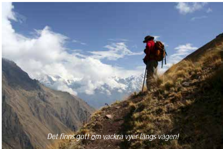
Det finns gott om vackra vyer längs vägen!

Ni går upp runt 6.00 och efter frukost lämnar ni Wayllabamba för att börja den svåraste delen av Inkaleden, som består av en brant stigning som varar ca nio km. Under denna stigning så förändras naturen, från sierran till punan , högländsterräng bestående av gult ichugräs och låga, vindpinade buskar. På vägen till det första bergspasset, Abra Warmihuañusca (den döda kvinnans pass), kommer ni att se domesticerade lamor och alpackor betades av ichugräset. Ni kommer också att vandra igenom molnskog, som karakteriseras av mångfalden av